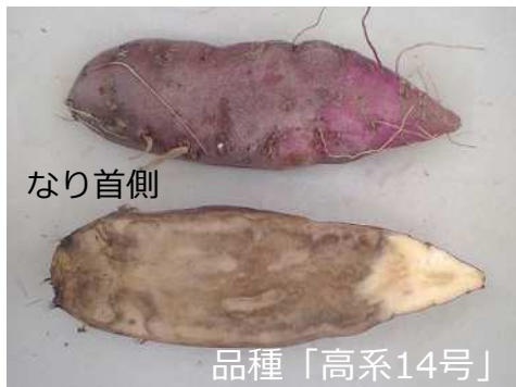
イモはなり首側から腐敗する