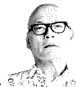
作・演出 田崎ヒサト

プラスチックゴミの問題が取り上げられる度に、私は故郷にある化学工場の事を思い浮かべます。その中で働いていたおばちゃん、おばちゃんたちの顔を。プラスチックやペットボトルが消えてしまうと、工場に支えられていた暮らしもなくなってしまふのか…。何が正しいのかは、よくわかりません。しかし、世の中あまりに正論が横行していて窮屈です。ひととき一緒に思いきりはみ出してみませんか？