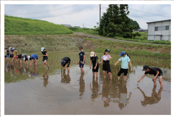
田植え体験 (緒方小学校)