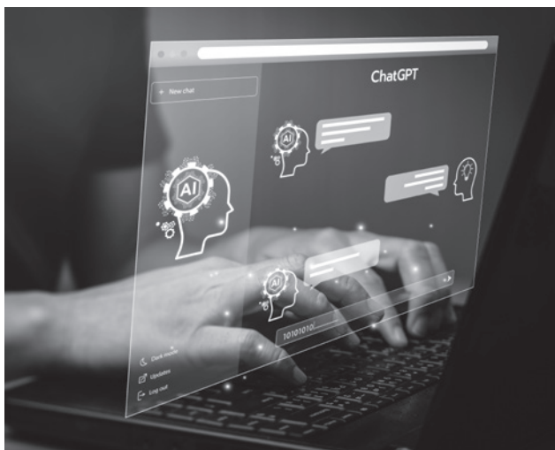
自治体でも試験導入が進むチャット GPT

今後、国の動向はもとより、県や他の自治体の取り組みや法整備等の動向を注視し、有効的な活用を公的指針等が示された段階で効果的な活用を図っていきたい。