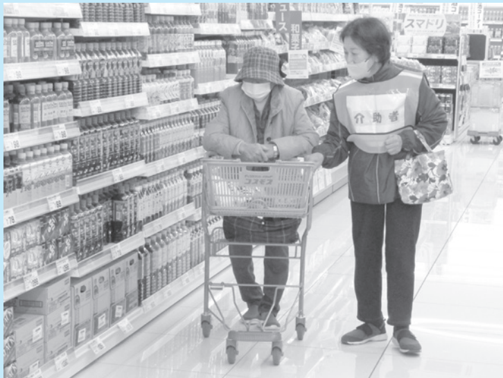
▲買い物シミュレーションの様子 (清川町支え合いのまちづくり仕掛人会)

し、あらゆる世代の交流と助け合いで地域福祉が推進され、全ての市民がその人らしく自立した生活ができる豊後大野市をめざして取り組んでいく。