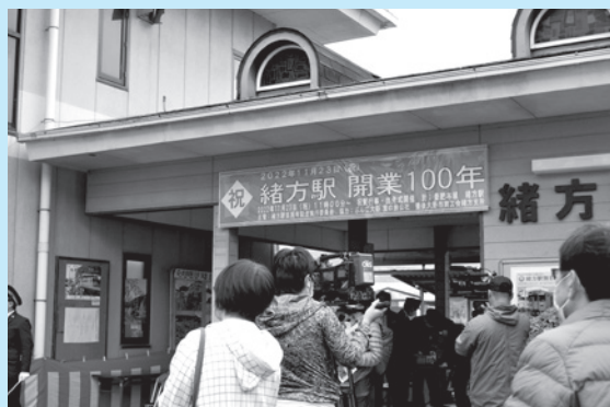
▲緒方駅開業100年イベントの様子

スポットライトの施工は「環境省が示す「光害対策ガイドライン」に沿った、環境影響への適正な配慮が必要になる。現時点で施工は困難であるが、防犯対策用としての照明は、別途検討する必要がある。