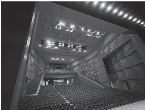
▲エイトピアおおの大ホール