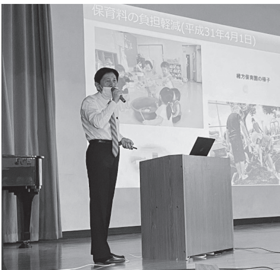
▲「総合的な探求の時間」における市長講演会 (三重総合高校)