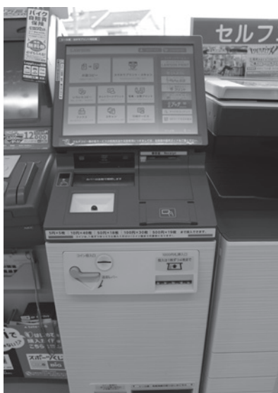
▲住民票等が取得できるキオスク端末 (市内のコンビニ)