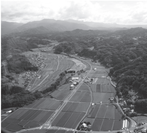
▲緒方川と緒方盆地