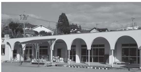
▲だいちこどもクラブ