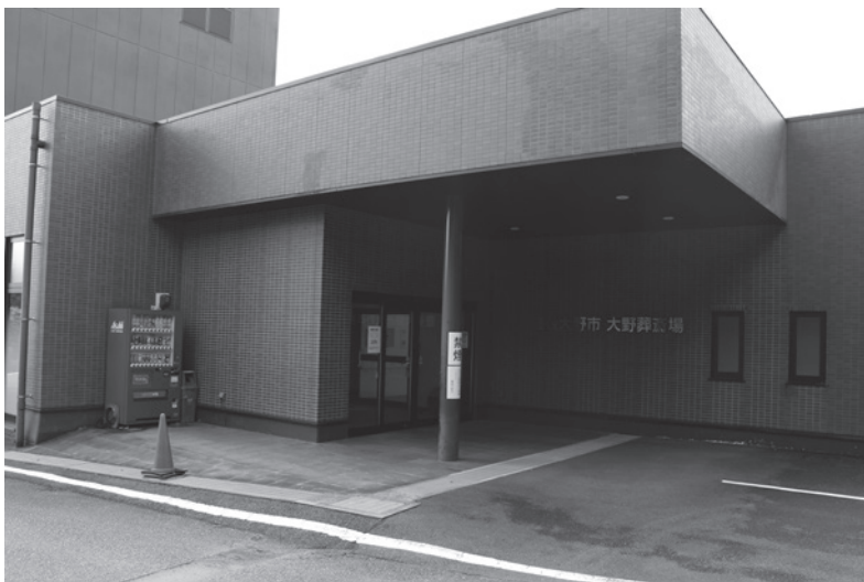
▲大野葬祭場（大野町）

残骨灰の処理業務については安価な応札金額であることから、有価物の処理との相殺であることは認識していた。