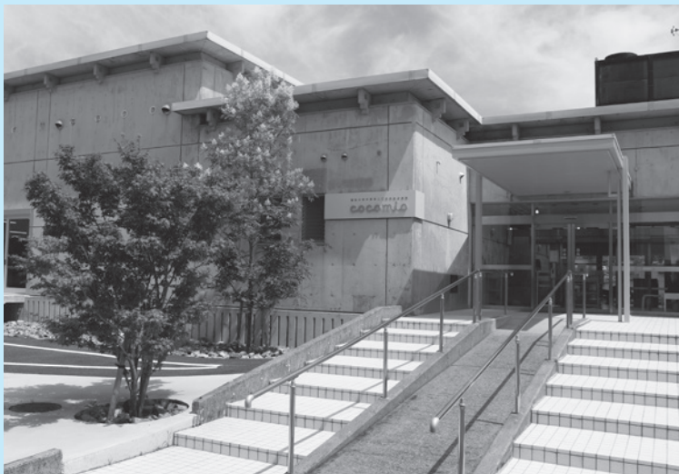
▲関係人口交流拠点施設 cocomio (緒方町)