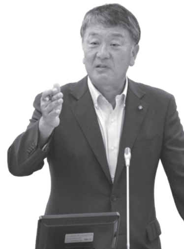
みね 英治 新 政 会