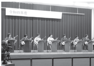
▲華やかな三味線演奏