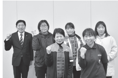
▲チーム一丸となって少しでも上を目指します!