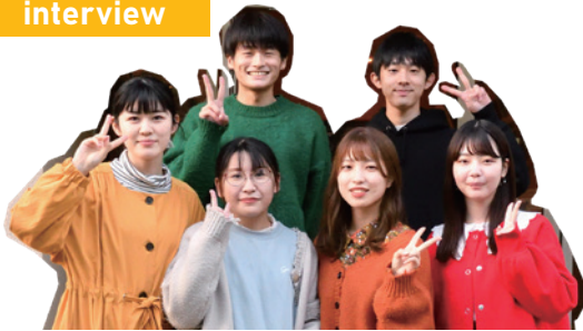
▲実験に参加した大分大学経済学部大井ゼミの学生の皆さん