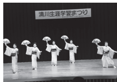
▲「清川民謡教室」の踊り