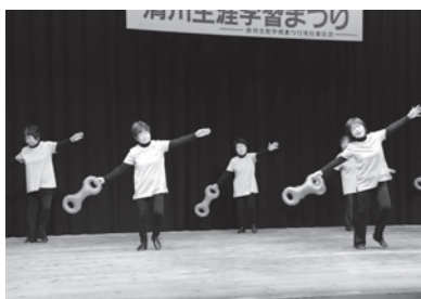
▲ベルを使った3B体操