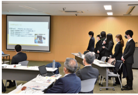
▲報告する大学生の皆さん

2月24日、市役所で開催された公共交通会議で社会実験に協力した大分大学の学生の皆さんが今回の実験の研究結果と課題を報告しました。社会実験に伴い、大学生は土師