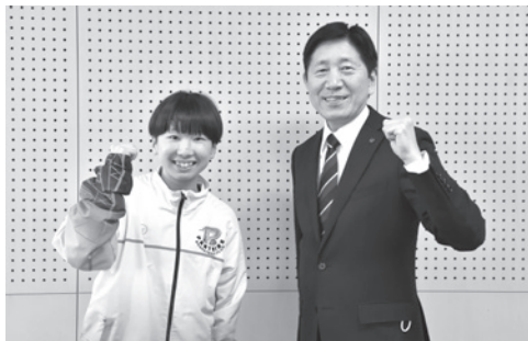
▲チームのために精一杯頑張ります!