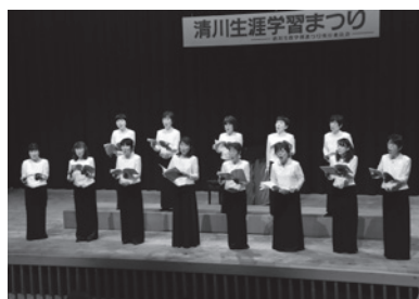
▲合唱するコールカスカータの皆さん