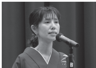
▲すばらしい歌声の民謡を披露