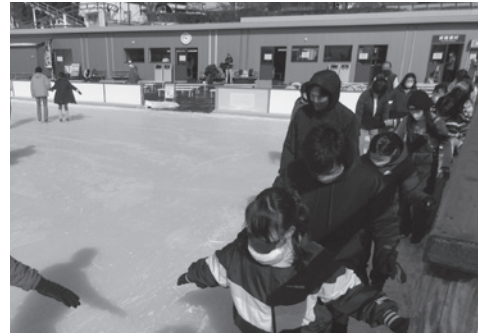
▲滑れるようになりました

1月29日、城島高原パークアイススケートリンク(別府市)で大野町スポーツ振興会主催の「スケートに行こう！」を開催しました。小中学生や保護者16人が参加し、大分県スケート連盟の方から分かりやすい指導を受けました。スケートが初めての参加者も、すぐに滑れるようになり、全員が笑顔で冬のスポーツを楽しみました。