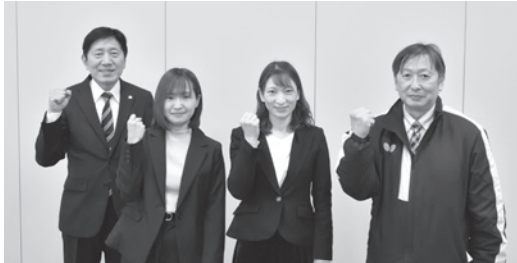
▲全力で勝負します