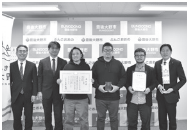
▲おんせん県いいサウナ研究所の皆さん

おんせん県いいサウナ研究所が、地域資源を活用したアウトドアサウナの取り組みで市の全国的な認知度向上や地域経済の活性化に寄与したことなどが評価され、ふるさとづくり大賞団体表彰で総務大臣表彰を受賞されました。その功績により、市長から感謝状が贈呈されました。