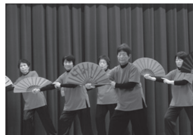
▲曲にあわせ太極拳