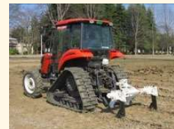
【例】排水対策（明渠、暗渠）