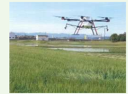
【例】スマート農業機器の活用