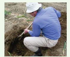
土壌診断に基づく施肥