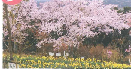
春は、ヤマツツジやサツキも咲き揃う