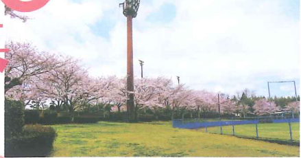
見応えある桜が咲き並ぶ