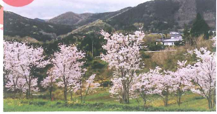
広い山面にいっぱいの桜