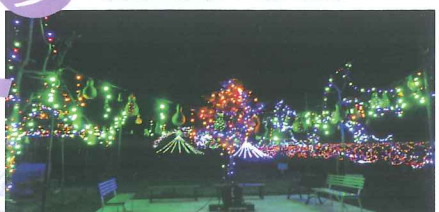
圧巻のイルミネーション。6万球の輝き