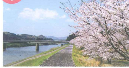
川に沿った、開放感のある桜