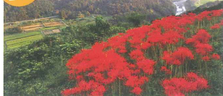
妙覚寺入口の東側と、東屋と参道の間広がる