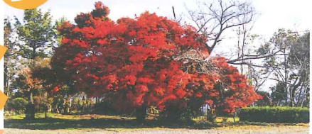
駐車場にある1本楓は真っ赤に紅葉する 参道には紅葉のトンネルができる