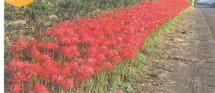
道路沿いに咲き、ドライバーの目を楽しませる