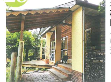
【住】千歳町下山962 【TEL】0974-37-2115 【時】11:00~15:00 【休】水・木曜