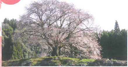
遠くからしか見られない隠れた名木