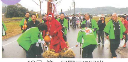
12月、第一日曜日に開催 ひょうたん様の御神酒は無病息災の効能あり