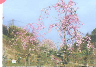
成長途中、年々綺麗に咲く