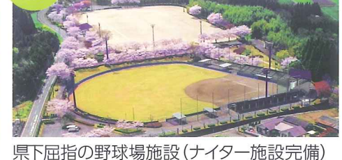
県下屈指の野球場施設(ナイター施設完備) 多目的グラウンド 400mトラック 【利用申し込み】千歳公民館 【TEL】0974-37-2069 インターネット申し込み可