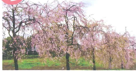
艶やかなしだれ桜

千歳には、その他にもそれぞれの地区で愛されている桜が点在しており日々の生活に春を届けてくれます。