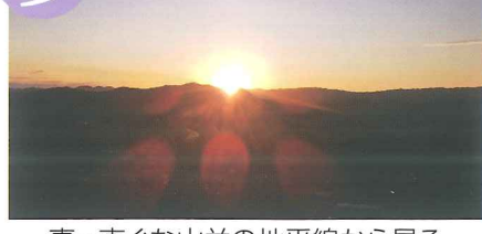
真っ直ぐな山並の地平線から昇る 御来光は感動を呼ぶ