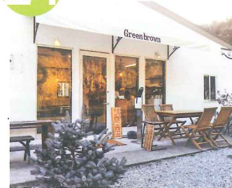
【住】千歳町下山878-3 【TEL】0974-27-5534 【時】10:00~17:00 【休】木曜、第2水曜(臨時休業あり)