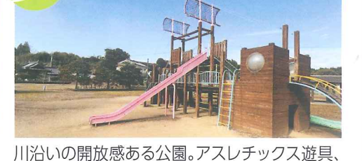
川沿いの開放感ある公園。アスレックス遊具、グラウンドゴルフ場、バーベキュー施設(利用申込必要) 【利用申し込み】豊後大野市千歳支所 【TEL】0974-37-2111