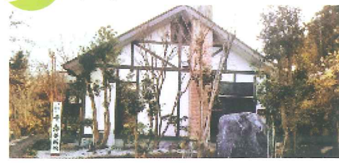
美術と音楽を楽しむ市民サロン 【住】千歳町下山1639 【TEL】0974-37-3355 【時】10:00~16:00(入館15:00まで) 【休】月曜日