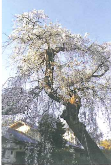
300年の歴史ある枝垂桜 風雨にさらされ今も立つ