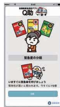
緊急度の分類説明