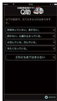
視覚効果 「明度反転」