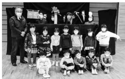
▲人形劇団と東幼稚園の皆さん

1月21日、東幼稚園で上記学級が開催されました。人形劇サークル「さんびきのこぶた」による「金の斧 銀の斧」「かさじぞう」などの多数の人形劇やパネルシアターが披露されました。園長先生から、「人形劇を通じて、正直な気持ちを育ててもらいたい」とあいさつがあり、園児の皆さんは、人形劇の主人公を真剣な眼差しで見っていました。