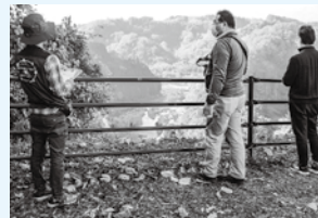
▲黒川滝でガイドからの説明