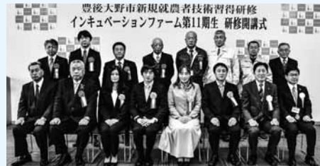
▲開講式終了後、激励をいただいた来賓の皆さんと記念撮影

本市の農業を守り育て、地域を担う若い農業起業者を育成するため平成24年1月から開始されたインキュベーションファーム事業(新規就農者技術習得研修)。1月7日、大野公民館で第11期生の研修開講式が行われました。2年間の研修を経て、3年目から本市で就農する予定です。