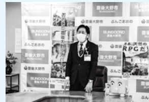
▲1月28日、市長から結果報告

▶問い合わせ先 商工観光課 ジオパーク推進室 ☎0974-22-1001(内線2459)