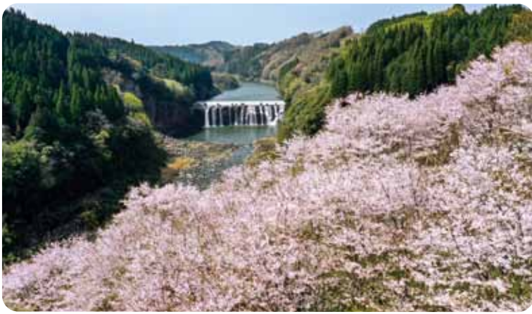
ドローンにて撮影