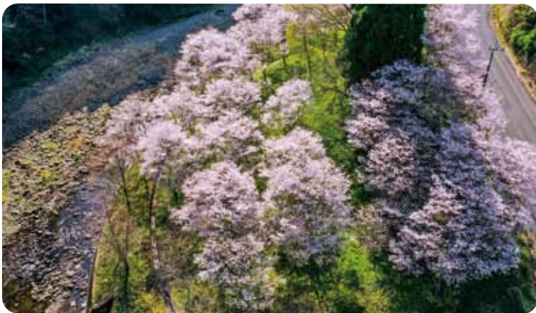
ドローンにて撮影