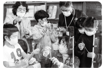
思いやりの心を育てる「シトラスリボン」づくり（放課後チャレンジ教室&あんしん研究会 & 三重町地域人権教育・啓発推進協議会）

今は100年前とは違い、多くの人々が自由に意見を交わせる時代です。 こうした時代だからこそ、「水平社宣言」に込められた当時の人々の思いに寄り添い、お互いを「尊敬し合う」ことにより、すべての人々の人権が尊重される真に自由で平等な社会を私たちみんなで作っていきましょう。