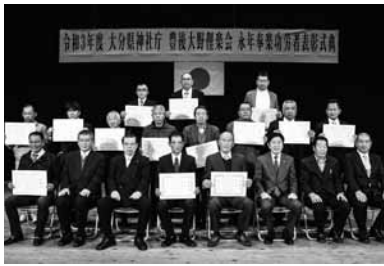
▲表彰された皆さん

神楽会館で、神楽社の楽員として長期間奉仕された方を表彰する永年奉楽功労者表彰式典を開催し、最高賞の50年表彰3人を含む21人を表彰しました。豊後大野俣楽会は11の神楽社で構成される団体で、神楽の啓発等の事業を行っています。