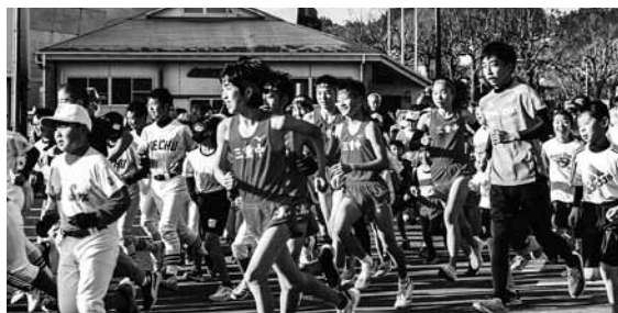
▲図書館前を一斉スタート

1月10日、上記大会が開催されました。スポーツ少年団や中学校の部活動、町内の歩こう会などから約370人が参加し、市図書館前から三重町内山観音(蓮城寺)までを往復する約5.5kmのコースで行われました。タイムを競う参加者はスタート後、一斉に内山観音に向け疾走し、健康づくりのために参加した皆さんは、ゆっくり走ったり歩いたりして汗を流しました。