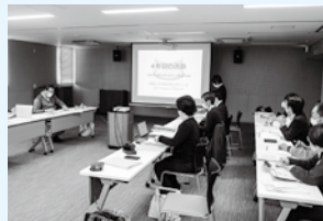
▲市役所でのヒアリング