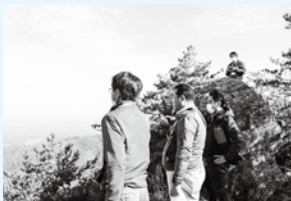
▲御嶽山での現地調査

今後もジオパーク活動による持続可能なまちづくりを推進していきますので、市民皆さまのより一層のご支援・ご協力をいただきますよう、お願いいたします。