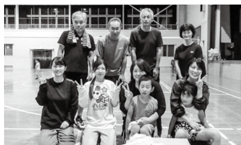
▲優勝した西部チーム