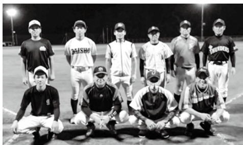
▲優勝したアクションズチーム