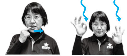
①白: 右人さし指で前歯を指さし、左へ引く。 ②両手の親指と人さし指で作った丸をひらひらさせながら下ろす。

12月号は「雪」を紹介。皆さんも一緒にやってみましょう。 ※ケーブルテレビ「週間！情報トレイン」でワンポイント手話講座を放送中です。