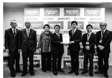
▲要望書を手渡す衛藤会長