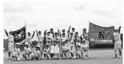
▲三重レッドソックス

上記大会が三重大原野球場などで開催されました。市内9チームが参加し、三重レッドソックスが優勝しました。 【大会結果】 優勝: 三重レッドソックス 準優勝: 三重ジュニア 第3位: 百枝若あゆ、 犬飼野球少年団