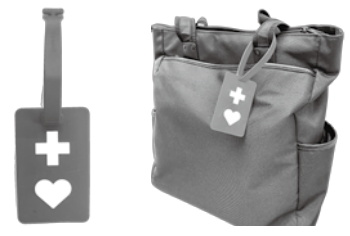
◀カバンなどに取り付けています。

ヘルプマークは、援助や配慮を必要としている人が、そのことを周囲に知らせるためのマークです。つけている方が困っているようであれば声をかけるなど思いやりのある行動をお願いします。