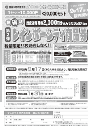
昨年度販売されたプレミアム付き商品券