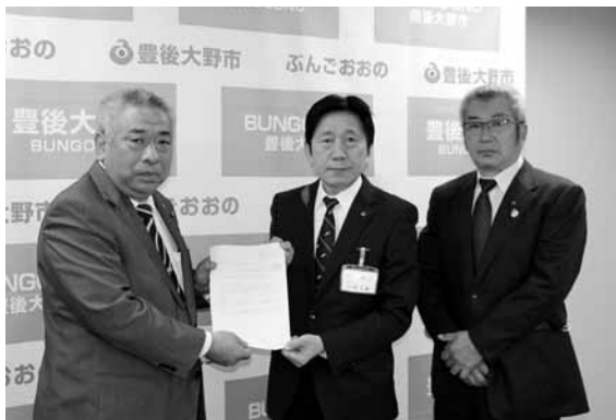
市長へ意見を提出

11月に開催した第9回議会報告会の中でいただいた意見のうち、執行部の見解が必要なものは、書面での回答を求めています。 今回、その回答が提出されましたので、内容の一部を要約してご紹介します。 提出された見解や取り組みの推移などは、議会として今後も注視していきます。 ※提出された見解はホームページにも掲載しています。