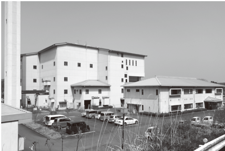
現在の豊後大野市清掃センター

調査、予測、評価し、より環境に配慮した事業内容となるよう実施しているもので、その第一段階として、環境配慮書を策定した。