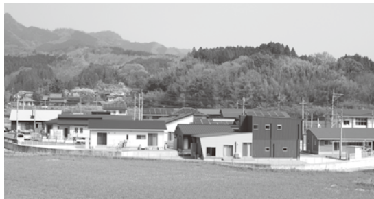
旧大野高校跡地の分譲宅地