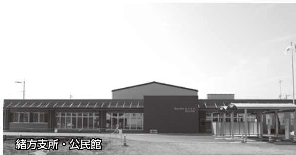
緒方支所・公民館