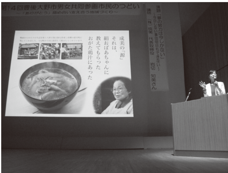
第14回 豊後大野市男女共同参画市民のつどい

災害対策に女性の視点を反映する体制が求められており、国は2020年の地方防災会議における女性委員の比率を30%と目標にしているが、本市の状況を伺う。