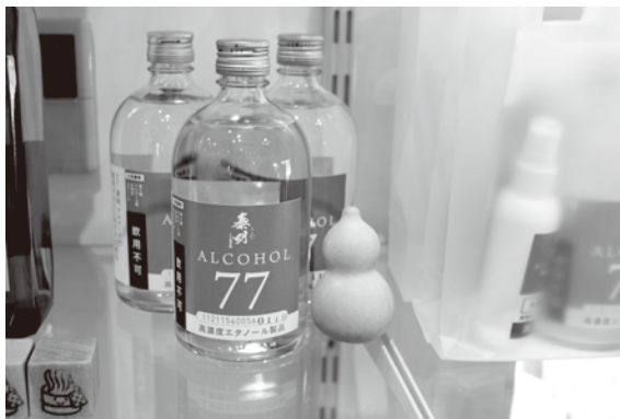
市内酒蔵が製造する消毒用アルコール

今後においても、社会情勢を注視しながら、時代に即応した観光施策を展開するとともに、引き続き、新型コロナウイルスの影響を受けている事業者の方に対し、必要な支援を行っていく。