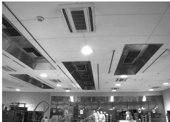
現在の換気空調設備 （三重学校給食共同調理場）