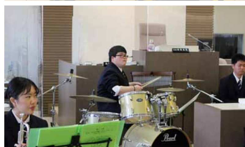
三重総合高校吹奏楽部による 議場コンサートを開催