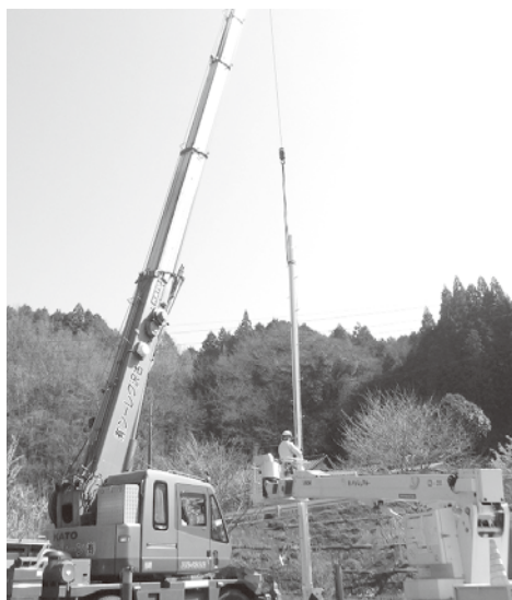
防災行政無線設置工事（大野町）

本格的に設置工事に取りかかっており、新設地区である緒方町と大野町及び老朽化により故障している清川町から着手している。今後については順次工事に着手する予定であり、令和3年度末までに完了し、デジタル化へ移行することとしている。