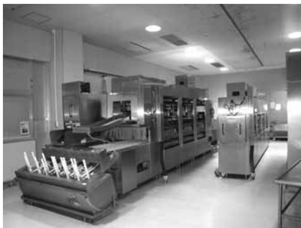
現在の食器洗浄機 （三重学校給食共同調理場）

→ 重学校給食共同調理場の食器洗浄機が → 購入後19年を経過し、老朽化による性能低下がみられることから、学校給食の安定供給を図るため、当該食器洗浄機を更新するものです。