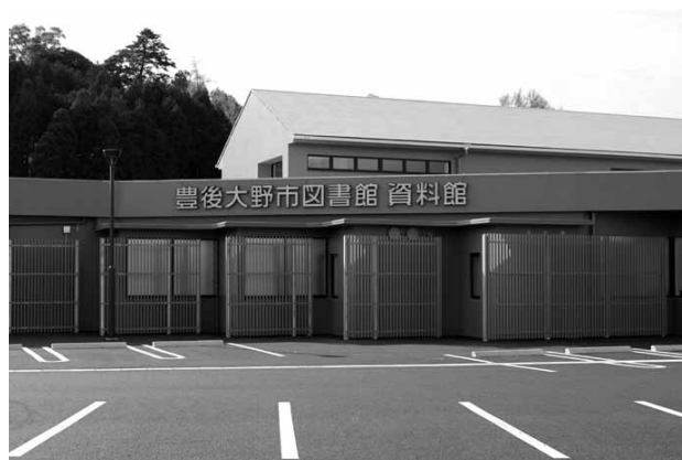
豊後大野市資料館