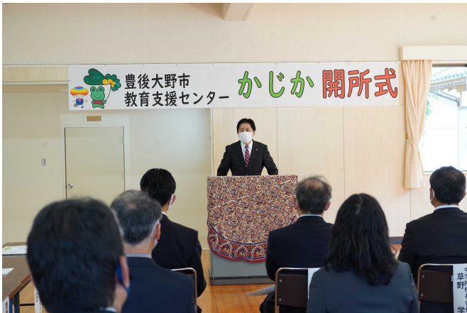
センター職員あいさつ