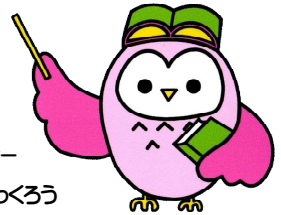
マスコットキャラクター ぶんごおおの ぶつこう