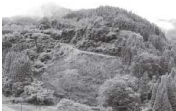
滞迫峡から見た森林