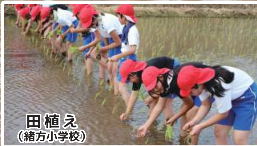
田植え (緒方小学校)