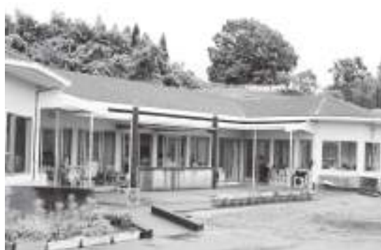
市立おおのさくら幼稚園

意識調査を行ったところ、小学校64%、中学校83%の生徒児童が肯定的な意見を出してくれた。