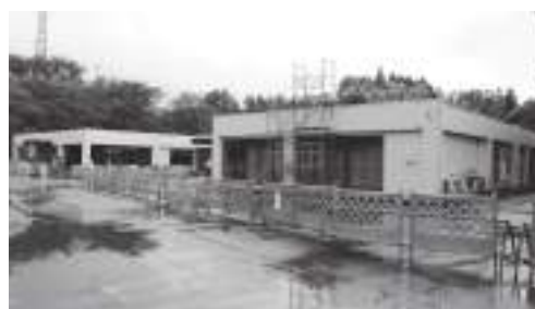
改修中の朝地公民館

公 民館の新築・改修・移転に伴い、公民館使用料を改正する必要があること、また、豊後大野市公民館に指定管理者制度の導入を行うために条例改正するものです。