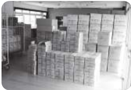
旧大野南部幼稚園に保管されている災害備蓄品

本市では災害等でのマスクの必要枚数を約3万枚と考えていた。2月当初、マスクの備蓄が約6万枚あったため、そのうちの約1万枚を荊州区に送った。