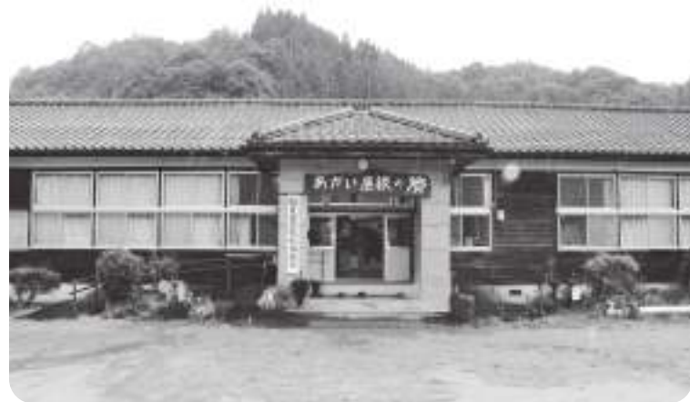
旧三重南小学校を拠点とした松尾・鷺谷振興協議会