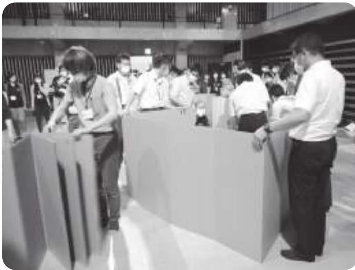
6月18日に神楽会館で行われた避難所開設の訓練

「発熱、咳などの症状が出た者のための専用スペースの確保」については、指定避難所以外に、現在2か所の避難所を確保している。