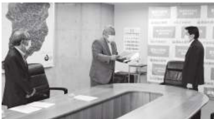
市長へ要望書を提出

また、5月22日の「豊後大野市議会災害・危機管理対策会議」を経て、市議会から「新型コロナウイルス感染症対策の強化や独自支援などを求める要望書」をいただき、直ちに要望の実現に取りかかったところである。