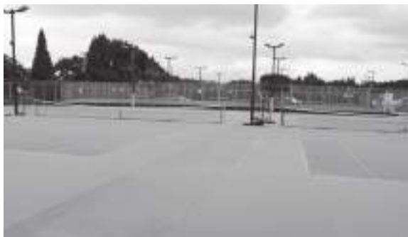
サン・スポーツランドみえ (テニスコート)

豊 後大野市体育施設条例に掲げる体育施設について、指定管理者制度を導入するため、条例整備をするものです。