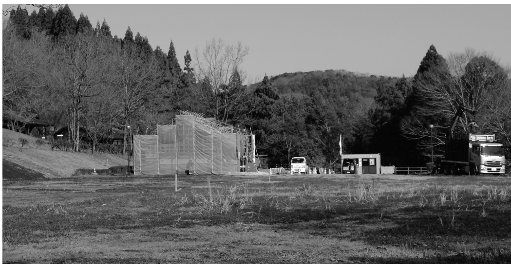
改修中のリバーパーク犬飼

豊 後大野市リバーパーク犬飼の指定管理者を指定することについて、豊後大野市公の施設の指定管理者の指定の手続等に関する条例第4条の規定により、G o a p 株式会社を指定管理者として選定するものです。