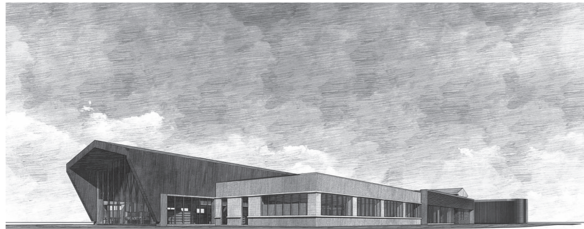
図書館・資料館完成予想図

豊 後大野市図書館・資料館建て替え工事の請負契約を締結するに当たり、豊後大野市議会の議決に付すべき契約及び特に重要な公の施設の廃止に関する条例の規定に基づき、議会の議決を要するものです。