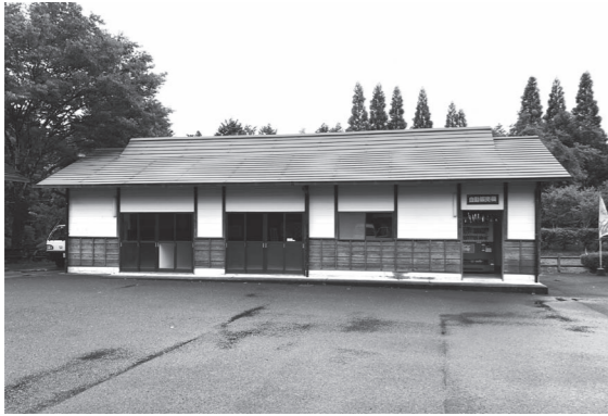
リバーパーク犬飼特産品販売所

リ バーパーク犬飼の再整備に伴い、リバーパーク犬飼特産品販売所を廃止するものです。