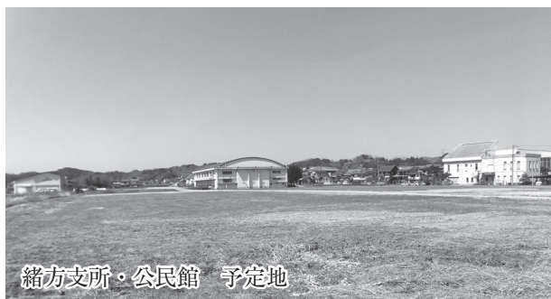
緒方支所・公民館 予定地

緒 方支所・公民館新築工事を有限会社宮成工務店と4億9,993万2千円で工事請負契約を締結するものです。