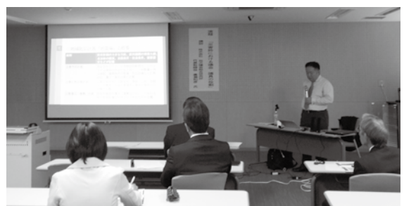
議員研修会の様子