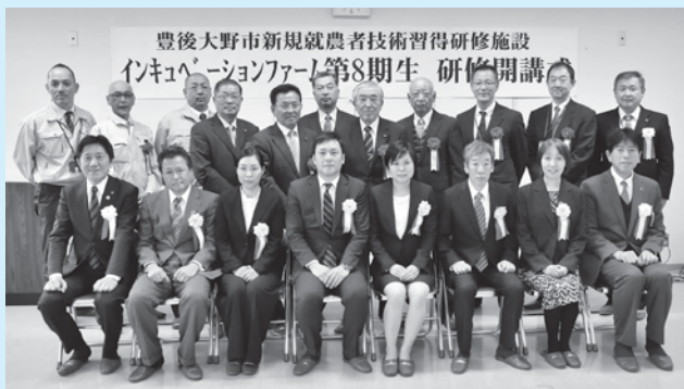
▲開講式終了後、激励をいただいた来賓の皆さんと記念撮影