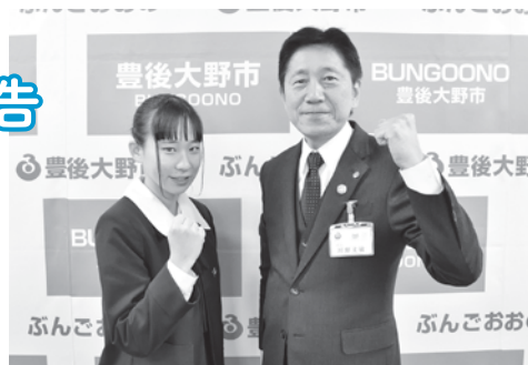
▲上位目指して頑張るぞ！