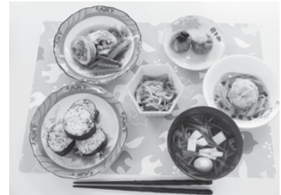
▲研修で作成した献立