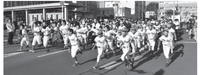
▲市役所本庁舎前をスタート・フィニッシュ

町内のスポーツ少年団や市内外から約400人が参加し、内山観音前で折り返す約5.5kmのコースを、歩いたり走ったりと思い思いのスタイルでフィニッシュを目指して楽しみました。