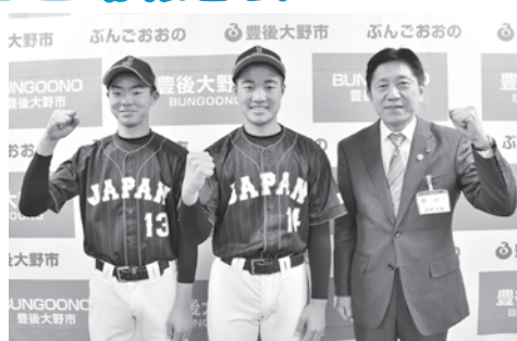
▲九州代表として気合い十分！