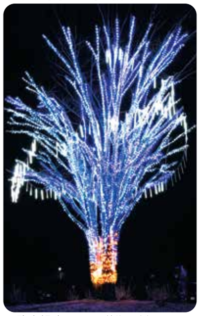
▲駐車場内のシンボルツリー