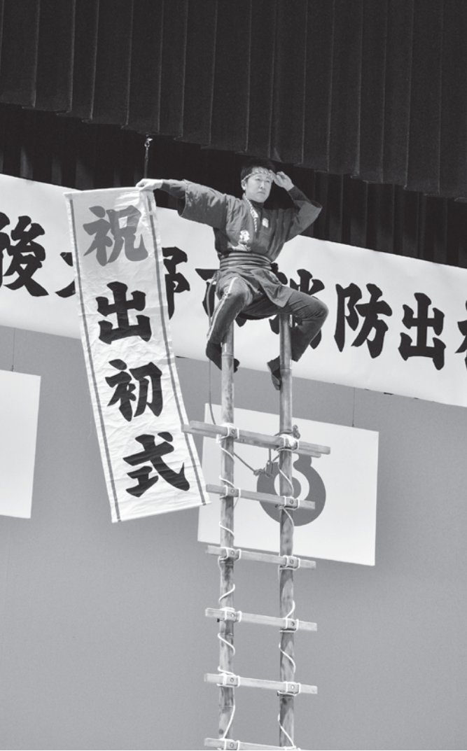
▲アトラクション 梯子乗り隊の演技