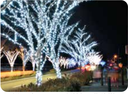
▲イルミネーションが美しい街路樹