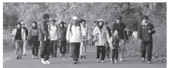
▲美しい景色を楽しみました!

歩いた後は、サイクリングハブ施設の足湯で疲れをいやし、食生活改善推進協議会大野支部の方が作ってくれたおいしい豚汁とおにぎりに舌鼓を打っていました。