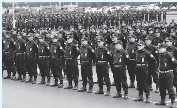
▲今年1月の市消防出初式での消防団