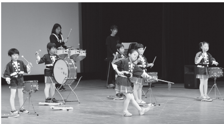
▲アトラクション おおのルンビニこども園幼年消防クラブ