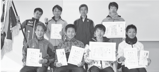
▲優勝した犬飼チームの皆さん

12月9日、市内5町がエントリーし上記大会が開催されました。 10時に犬飼公民館前をスタートし、市役所本庁舎前をフィニッシュとする市内一周8区間43.6kmで各町代表選手が健脚を競いました。 結果は次のとおりです。(敬称略)