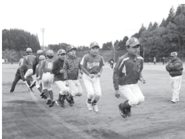
▲大なわとびの様子