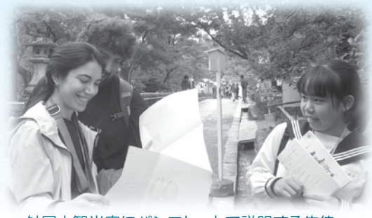
外国人観光客にパンフレットで説明する生徒