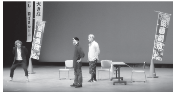
▲警察署「後藤劇団」の迫真の演技