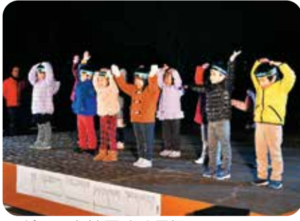
▲ダンスを披露する園児

イルミネーションは、2月末まで日没から22時まで点灯する予定です。光に彩られた原尻の滝周辺を散策してみてもいかがでしょうか。