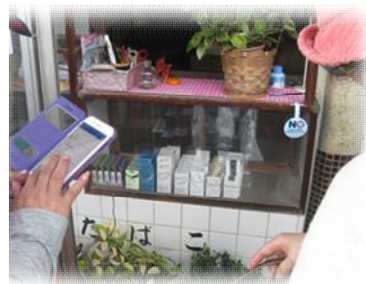
懐かしい煙草屋さんを見つけて早速写真を