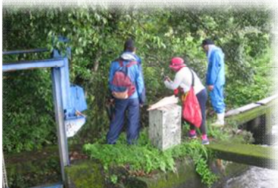
井澤氏は井路に興味津津