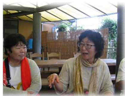
最後は一人ずつ感想を