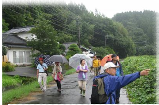
参加者の中には自然観察のプロも