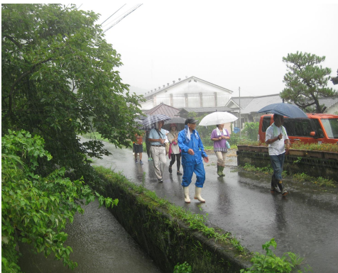
途中台風の影響で土砂降りに・・・