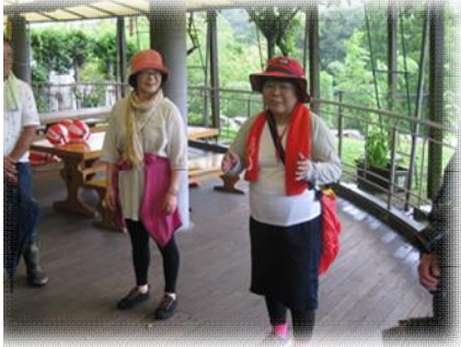
出発前にコースづくりの極意を

講習会の2日目は実際にコースに出て井澤氏にコースづくりのポイントについて指導していただきました。