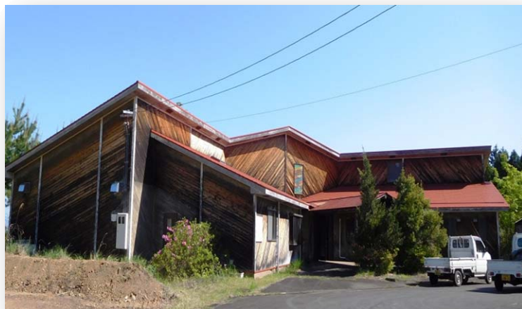
御嶽山緑地等管理中央センターの外観