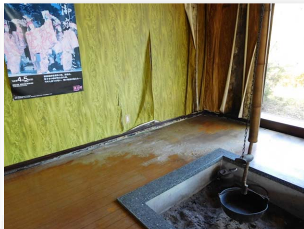
雨漏りによる水害被害