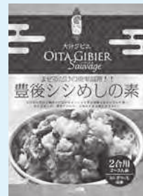
豊後シシめしの素