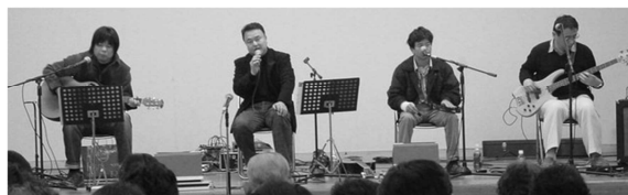
***イソジンス Water Level Company***