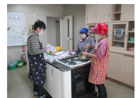
ふれあい料理教室調理の様子。

実用書道教室以外の教室は途中からの申込みもできます。興味がある方は隣保館にご連絡ください。