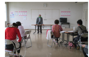
石川啓発指導員による講話の様子。教室生は真剣に聞いていました。

教室前の限られた時間ではありましたが、部落差別問題に対する理解が深まったと思います。