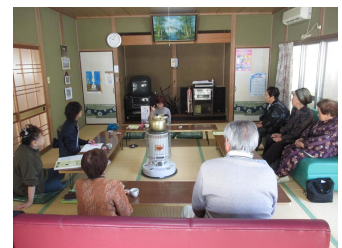
出前隣保館での講話の様子