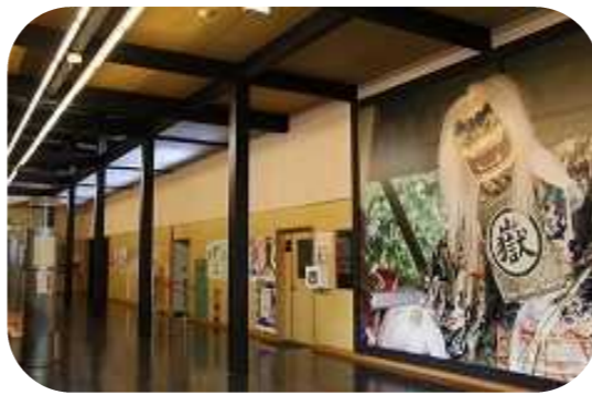
須佐之男命がお出迎えします。 見学は無料です。