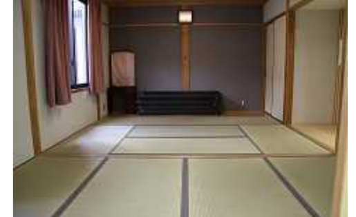
和室2は、調理室に隣接