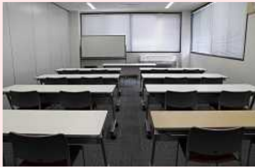
2人掛け: 16人 3人掛け: 24人