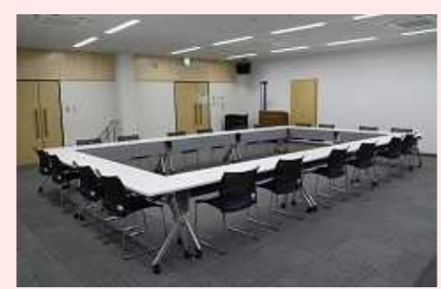
2人掛け: 20人 3人掛け: 30人 長机20, イス30, 演台, 放送機器