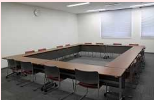
2人掛け: 16人 3人掛け: 24人 長机11, イス30, 演台