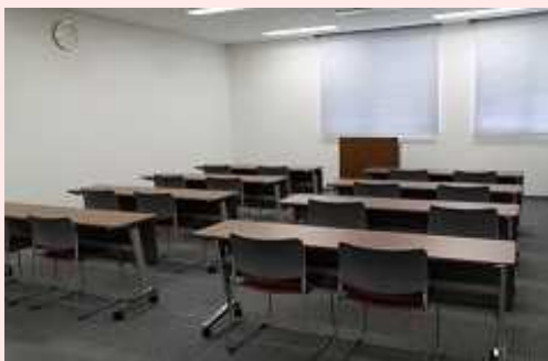
2人掛け: 16人 3人掛け: 24人