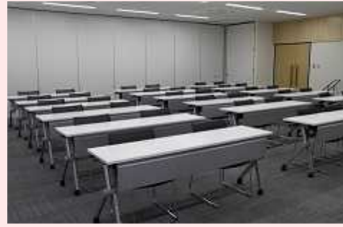
2人掛け: 36人 3人掛け: 54人