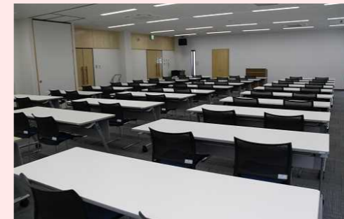
2人掛け: 60人 3人掛け: 90人