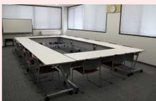
2人掛け: 12人 3人掛け: 18人 長机10, イス30, 電子ピアノ