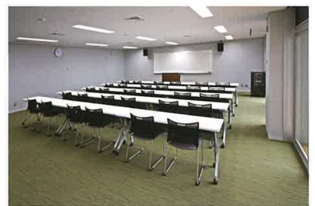
第1会議室：約60人収容