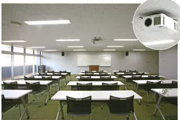
視聴覚室：プロジェクター備え付け/最大80人収容