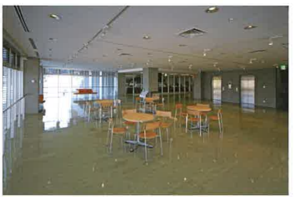
公民館ロビー：展示スペースがあります。