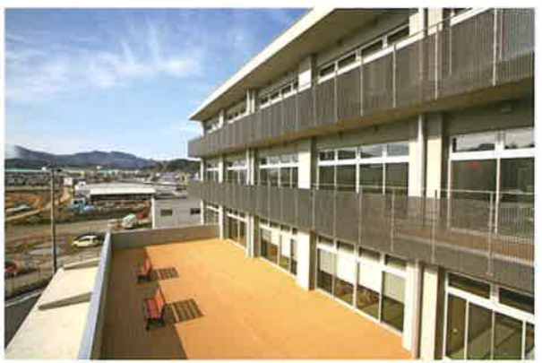
ルーフテラス：屋外のテラスです。自由にご利用ください。