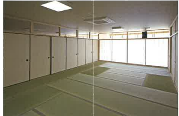
和室：一部屋約20人収容