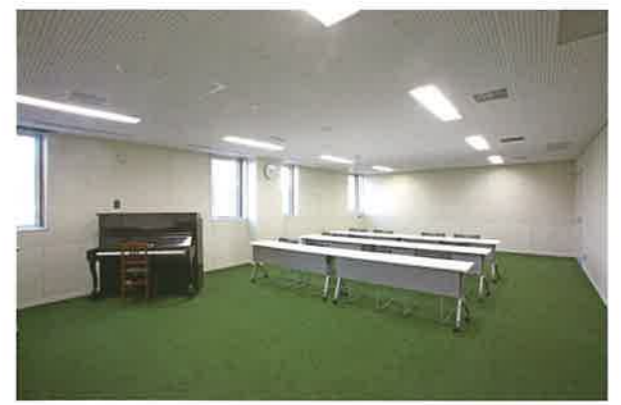
音楽室：ピアノ1台/約30人収容