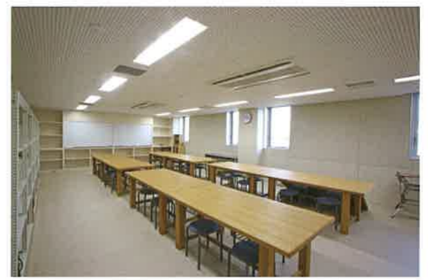
美術工芸室：作業第8台/約30人収容