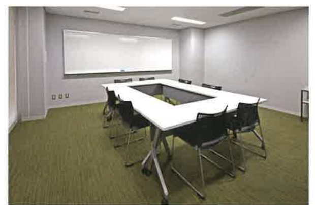
第3会議室：約20人収容 第4会議室：約20人収容