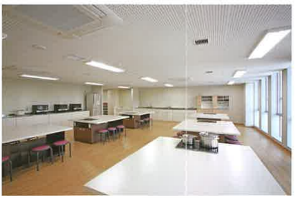
調理室：調理台6台(すべて電磁調理器)