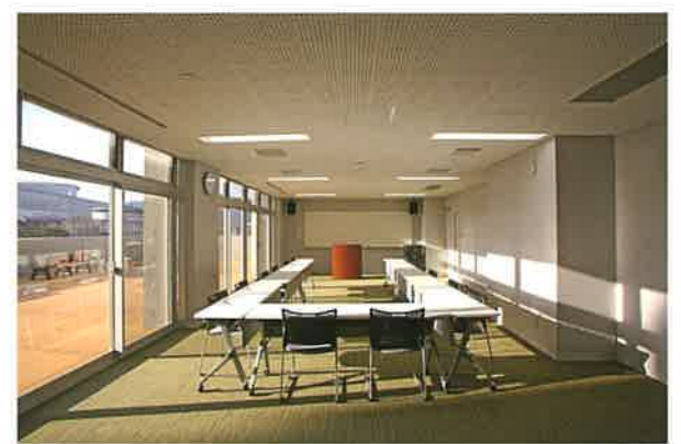
第2会議室：約40人収容