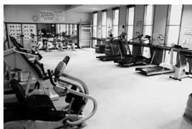
千歳町保健センター