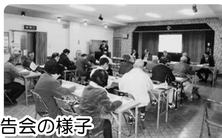
前回の議会報告会の様子