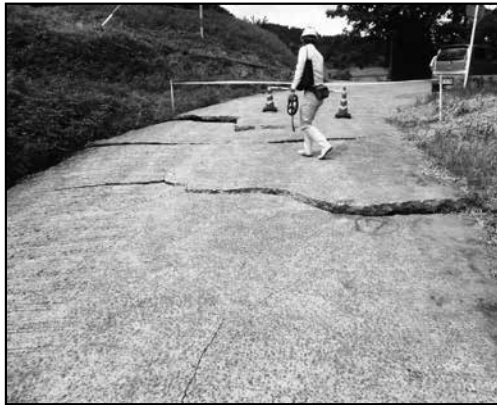
市道 (5月22日 市道下側から撮影)