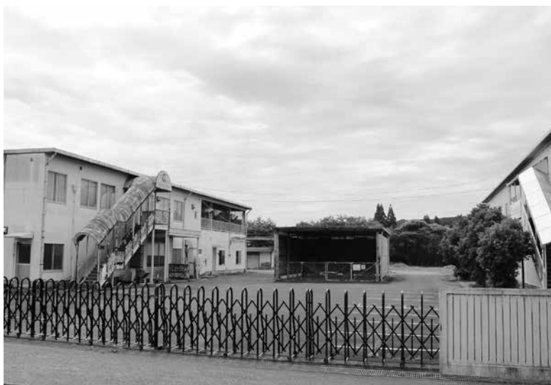
企業進出予定地（犬飼町田原）