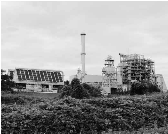
木質バイオマス発電所

新電力会社の目標は、 再生可能エネルギー1 00%の電源確保です が、全量が確保できな い場合は、九州電力の バックアップ電源や日 本卸電力取引所からの