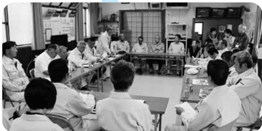
6月12日 関係者、避難者の方と意見交換