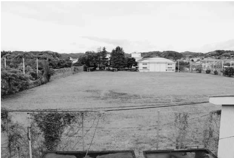
旧緒方工業高校跡地

平成30年4月を開校予定として豊西准看護学院が移転を予定しています。その他の利活用は旧緒方工業高校跡地整備活用基本計画を検証し、有効活用の可能性を探ります。