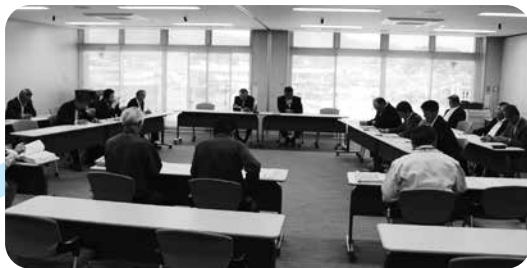
5月22日 地すべりの状況説明を受ける