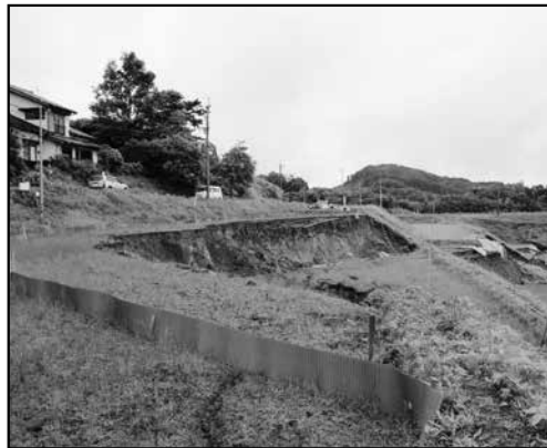
地割れが拡大 (6月28日 撮影)