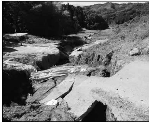
崩壊した市道 (6月9日 市道上側から撮影)