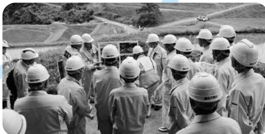
6月12日 議員が現地を調査

議会活性化委員会も新たな委員構成となり、今後新たに調査、研究する項目や年間スケジュールなどについて、協議しました。