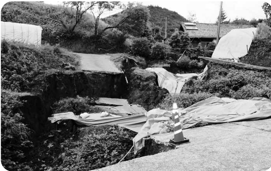
綿田地区の市道の現状