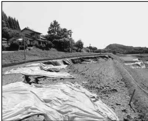
農地 (5月29日 撮影)