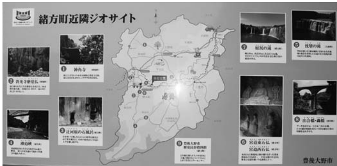
緒方駅に設置された看板

ジオパークの実績を 積み重ねており、自然 歴史、文化、産業を見 つめ直し、守って、学 んで、楽しむジオパー