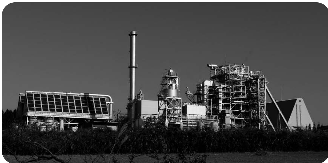
木質バイオマス発電所