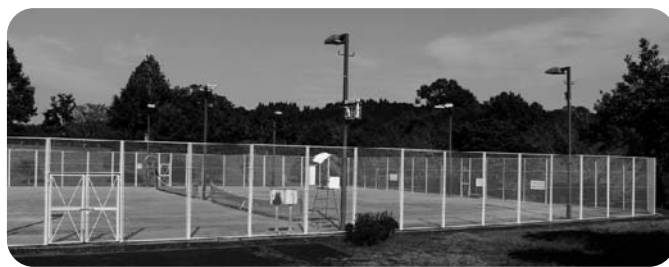
リバーパーク犬飼 テニスコート

利用状況は平成27年実績で、市施設の有料利用者が1万5592人でした。収入は、市と県の施設を合わせて607万9410円で、運営にかかる経費は2022万9726円を要しており、1415万316円のマイナスとなります。