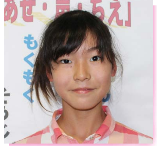
三重第一小学校 6年