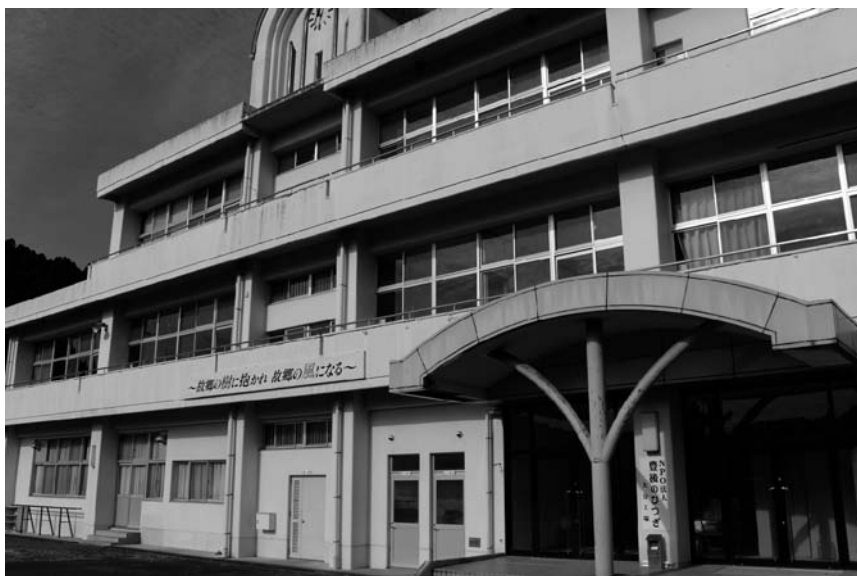
旧大野西部小学校

機械搬入の完了は11月23日、平成29年3月から商品の本格製造、4月から販売を開始したいと伺ったところです。