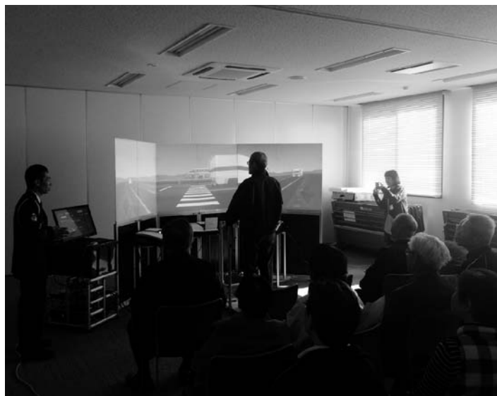
シミュレーター体験