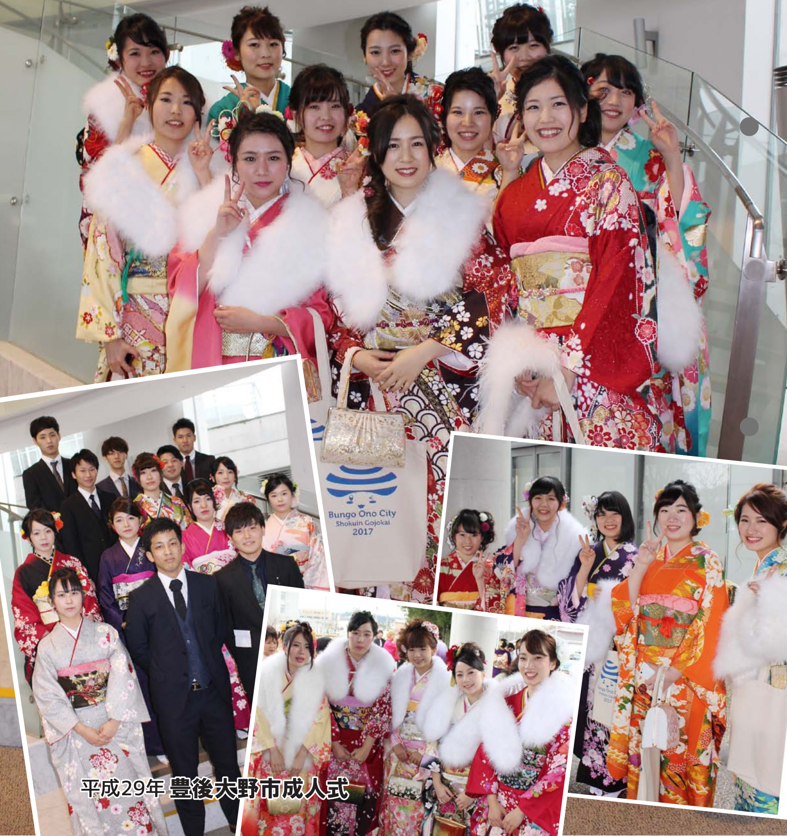
平成29年 豊後大野市成人式