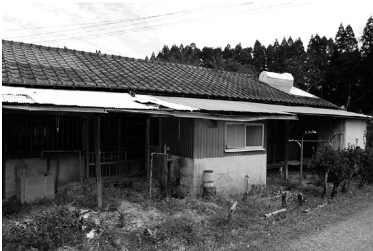
募集停止した市営住宅

近年、新築や建てかえ事業に活用する国の補助金等の配分が厳しい状況ですが、計画的に住宅整備の推進をしていきます。管理は引き続き豊後大野市営住宅管理センターと連携して維持・管理に努めます。