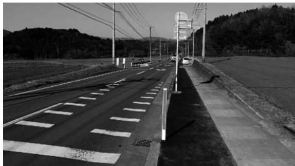
千歳簡水送水管布設工事の状況

【付託議案の審査結果】 議案4件を付託され、慎重審査の結果、それぞれ可決すべきとなりました。