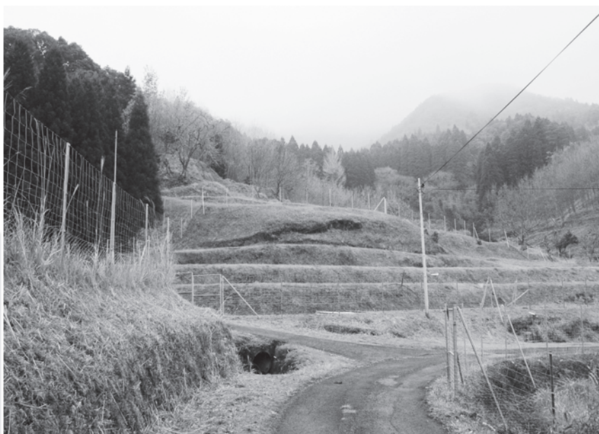
緒方町長谷川地区