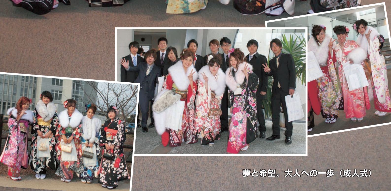
夢と希望、大人への一步（成人式）