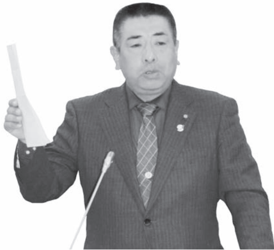
や たつ とう え 哉 竜 藤 衛