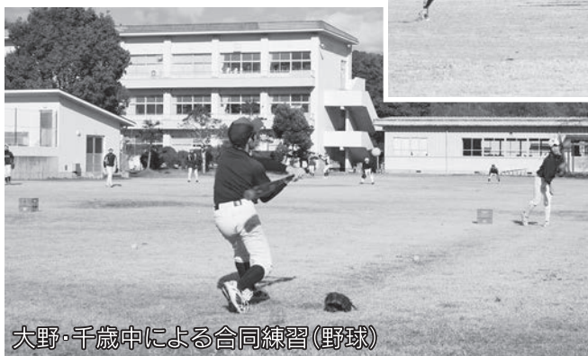
大野・千歳中による合同練習(野球)

平成24年度より、複数校合同チーム編成規定を策定し、その結果、バレーボールや野球で中体連や新人大会に複数校の合同チームで参加しました。