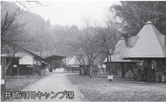
井崎河川キャンプ場

ており、今後も引き続き見直しの方針に基づき取り組みを強化していきます。 今後の利活用は、現状で取り組みが可能なものは、関係機関・団体などにPRなどを行い、施設の利用度を高めていきます。