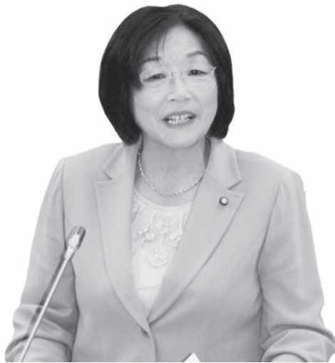
こ ちよこ ちよこ 藤 恵