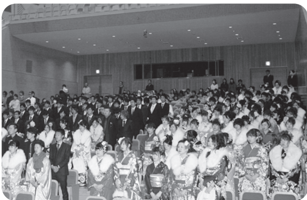
大ホールで行われた成人式

なお、今後、指定管理料は市の予算の範囲内でやっていくことを企業に了解いただいている。