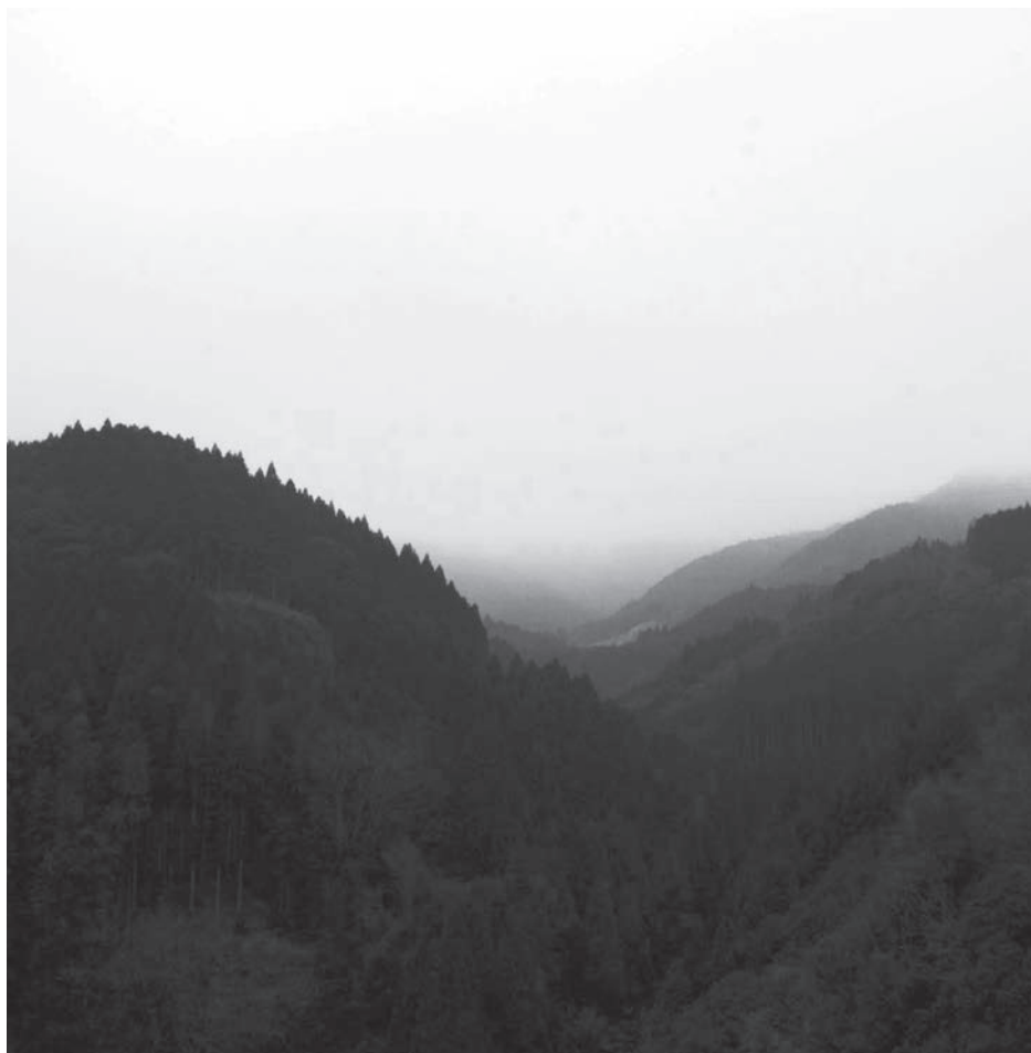
※写真と本文は関係ありません。

また、森林の売買そのものを規制することはできませんが、既に「市水道水源保護条例」や「市自然環境保全条例」を整備しており、今後も土地の開発行為に対する対策に取り組んでいきます。