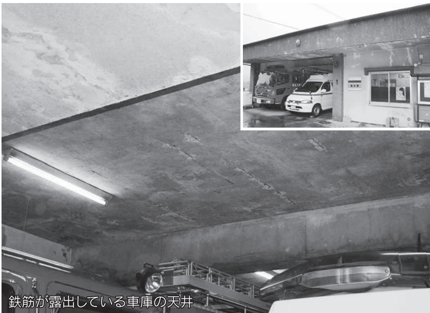
鉄筋が露出している車庫の天井

現在、犬飼保健センターの今後の有効利用について関係課と協議を進めており、平成26年3月定例会において、一部改正に係る条例の提出を考えています。