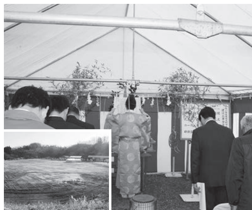
第1発電所での起工式