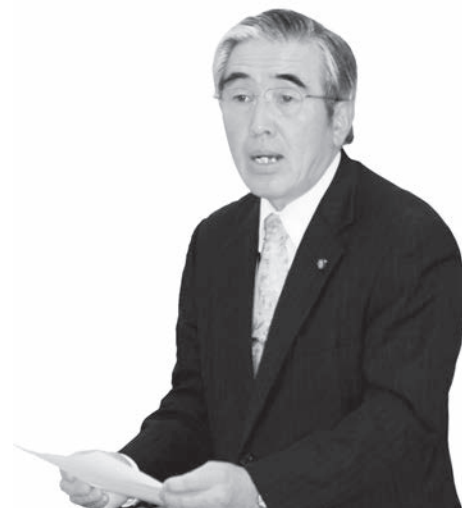
み 己 辰 藤 佐 さ とう たつ み 佐 藤 辰 己