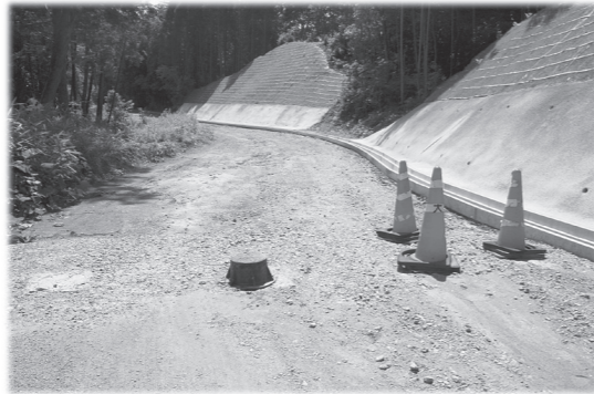
集落道石田大迫道路 (千歳町)