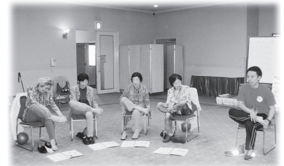
いきいき介護予防教室「元気学校」

●少人数学級の推進などの定数改善と義務教育費国庫負担制度2分の1復元を図るための、2014年度政府予算に係る意見書採択の要請