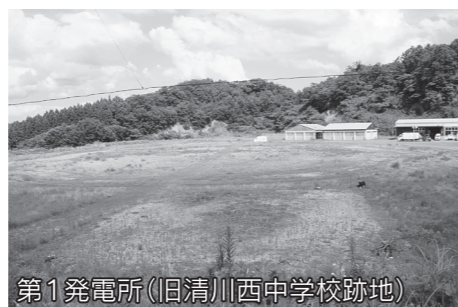
第1発電所(旧清川西中学校跡地)