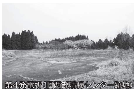
第4発電所(旧西部清掃センター跡地)