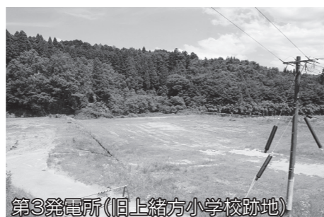
第3発電所(旧上緒方小学校跡地)