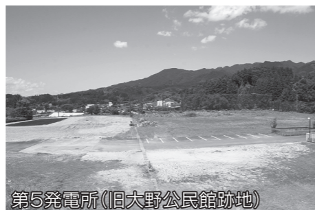
第5発電所(旧大野公民館跡地)