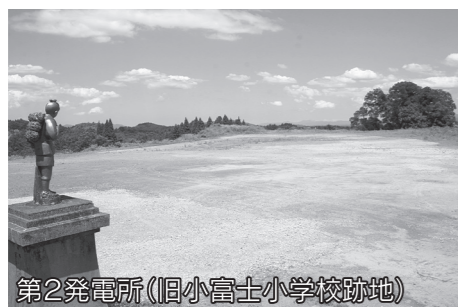
第2発電所(旧小富士小学校跡地)