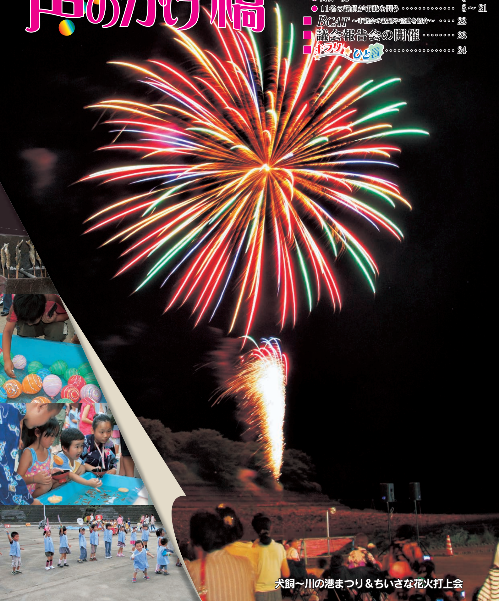
犬飼～川の港まつり&ちいさな花火打上会