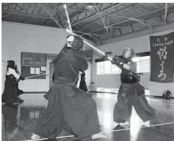
武道風景（三重中学校）