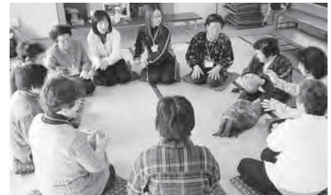
いきいきスマイル教室（大野町）

今後は地域の地区診断、地区がどうあるのか分析し、地区自体で健康づくり計画などができるような体制になればと計画中です。