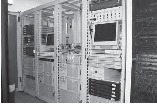
NTTビルにある現電算システム