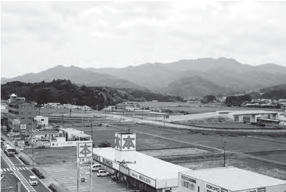
大型店進出が予定されている下赤嶺地区

「豊後大野市総合計画」を基軸に、主要の施策を策定し事業を行ってきたが、施策も各事業内容により多くの実施計画などが策定されています。これらの計画や事業の策定過程において、少しでも多くの市民の皆さまから市政に対するご要望などを聞くことに努め、職員に対しても限られた財源の中での効率的な執行、適切な状況判断、政策形成能力を思索し、実行する姿勢を持つよう訴えてきました。