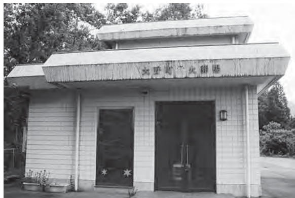
大野葬斎場（大野町）

建設基本計画などについては、自然、社会環境条件、立地調査、施設規模、事業費など多角的に検討する必要があります。