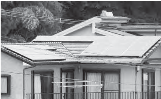
個人住宅用太陽光発電装置

却に70年ほどかかることが予想されるため、太陽光発電設備については採用しないことといたしました。 庁舎建設にあたりましては、施設整備方針に基づき、できる限りのエコ対策に取り組んでまいります。