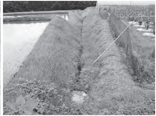
排水路工事 (清川町中村)