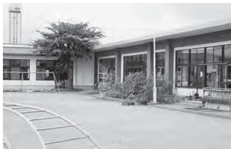
(上)三重東保育所 (下)緒方保育園