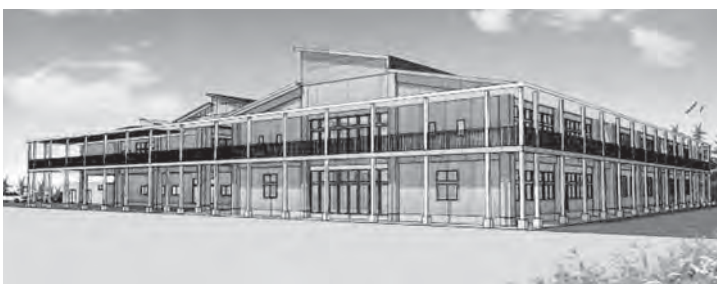
清川中学校完成予想図