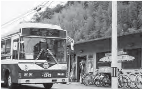
市民病院発～犬飼駅着