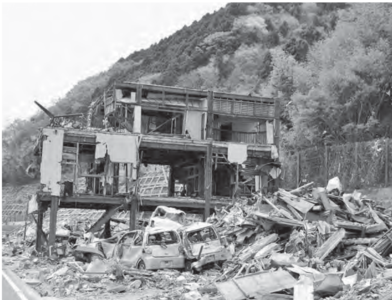
宮城県石巻市の被災状況

福島第一原発の事故により、脱原発の動きが強まっている。電力を消費している私たちにも、節電に対する覚悟が必要と思うが、考えは。