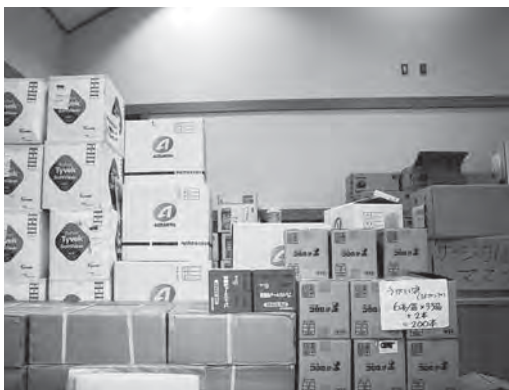
千歳支所に保管している防災資機材