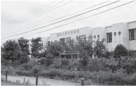
豊後大野市民病院

乗降調査 じやうりやうさぎ を行いました。乗降調査を行いましたが、利用者が少なく、また周知などが充分とは言えないことから、本年9月まで引き続き乗降調査を行います。