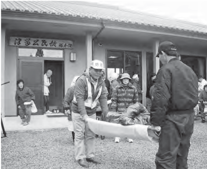
手作り担架で搬送訓練（大野町津留地区）

める自治会数は23自治会に上り、今後はさらに広がるのが予想されます。 民生委員を中心に「災害時要援護者名簿」を約2200人を対象に作成して、「あんしん見守りボトル」を配布・設置したところです。 本年度は支援対策を推進するため「協力員」を選任する予定です。