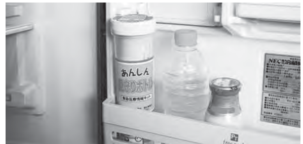
冷蔵庫内に設置されているあんしん見守りボトル