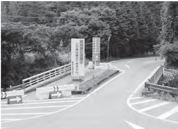
市道牛首線の矢田橋