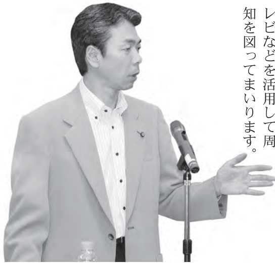
こうじな ふみ ひろ 神志那 文 寛

保険税未納世帯の納付状況によって交付する短期被保険者証世帯数は、575世帯です。