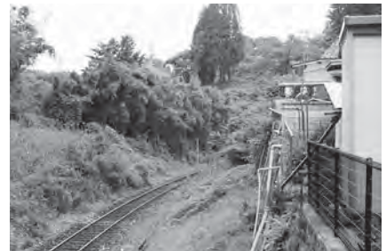
JR線への崩落危険市有地

答 建設部長 市道は1487路線あり十分な把握ができていません。各地区で道路愛護作業をしたとき、また、地域担当職員制度導入により自治委員から改良・補修工事など必要な箇所の要望書を提出していただいた案件については、整理を行っています。 橋梁については、市が管理する橋梁点検結果を市のホームページに掲載しています。