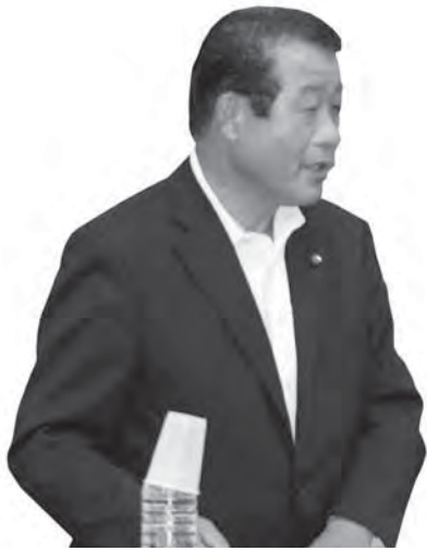
おみや 成寿 男 みや 成 寿 男