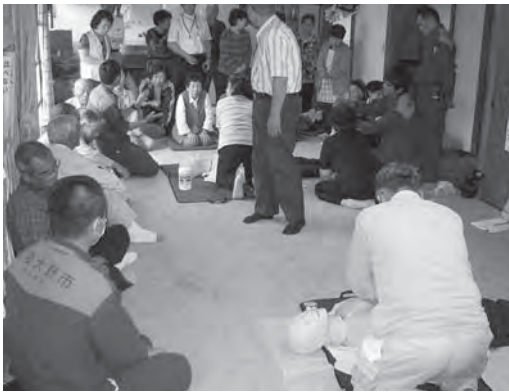
心肺蘇生訓練 (犬飼町小福手地区)

東日本大震災の状況からも、大災害時には大変重要なことで、いざというときの実践的な備えとして、消防署、消防団をはじめ関係機関と連携し、これまで以上に取り組んでまいります。