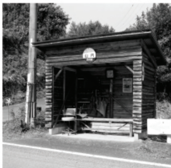
地域の方に支えられるバス停

④ 道路管理者や警察などとの協議や許可用地や歩道の確保など、関係機関の努力が必要であり、総合的に検討します。