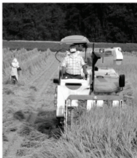
農作業にも安心な補償を

質 旧大野町で農業者より高い支持と評価を得ていたこの制度は、現在でも廃止されたままである。 その復活と市全域を対象とする制度化を求める。