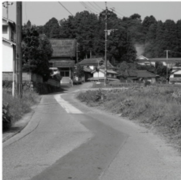
改良が待たれる生活道路

なお、現時点で車の離合が困難など交通安全対策が不十分な箇所については、緊急性を考慮して対応してまいります。