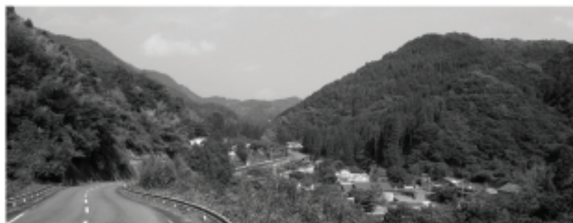
電波が届きにくい大野町北部地域

対象地区 大野町中土師・安藤地区 工事請負費 5683万4千円 実施設計委託料 300万円 その他 46万6千円