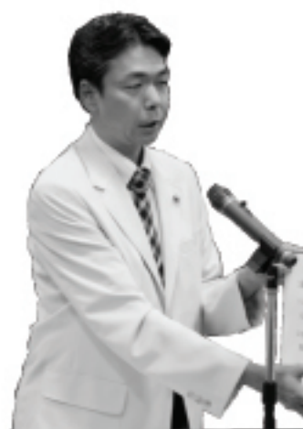
こうじな ひろ 文 寛 神志那 文 寛

公約の柱に打ち出した政党が政権党となり、廃止の方向で動いております。県下の市町村会で、この制度がどう運用されていくか話していきたい。