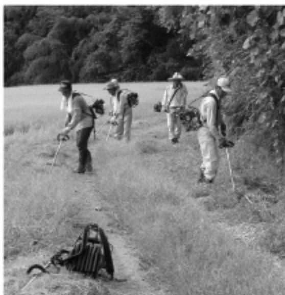
共同作業で農道管理(大野町)

質 「懸念される米国の自由貿易」と「守るべき中山間地域等直接支払制度」について。