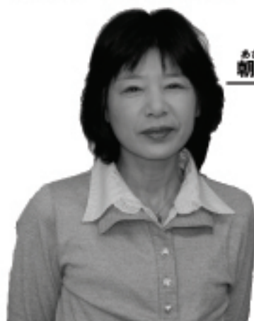
あさじまち いちまんだ 朝地町市万田