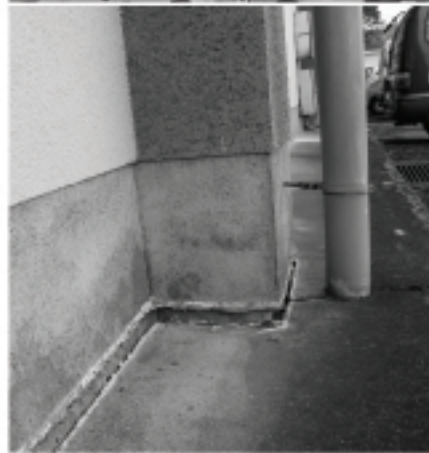
老朽化が進む本庁舎