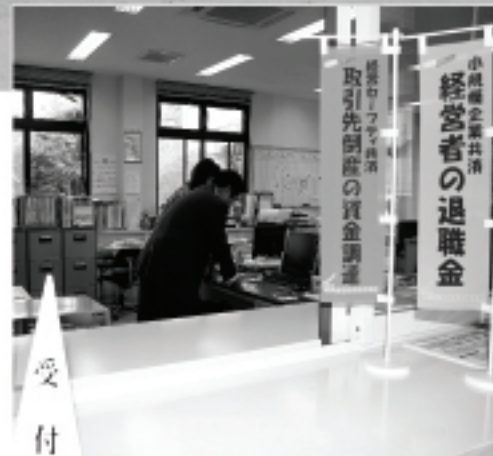
相談は豊後大野市商工会へ

安定対策事業」や「自給飼料確保向上対策事業」を実施し、「自給飼料確保向上対策事業」については、平成21年度も事業を継続しております。 さらに、農業経営の支援体制として、相談窓口を担い手育成総合支援センター内に開設し対応しています。 農業関係では、日本政策金融公庫の制度資金「農業経営基盤強化資金（スーパージ資