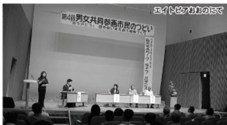
エイトピアおおのにて