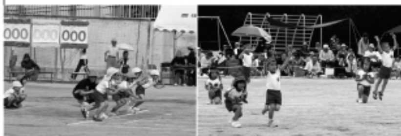
三重東幼稚園の運動会