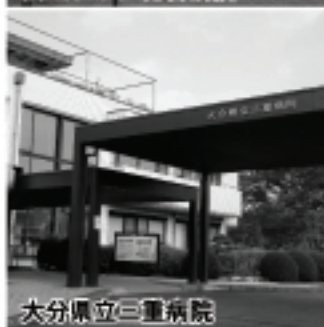
大分県立三重病院