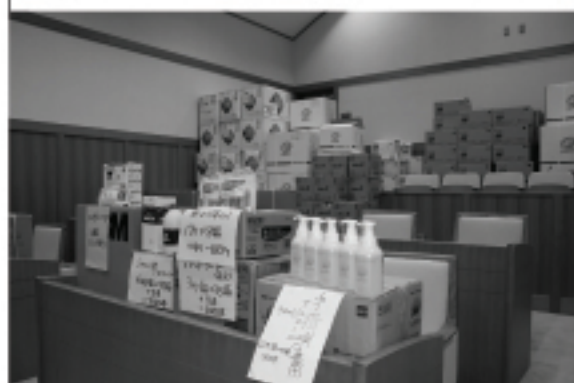
備蓄されている予防薬