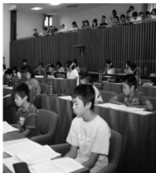
第3回豊後大野っ子市議会

答 総務部長 現在、犬飼町と緒方町が完了しているが、残る5町については、今後40年間で調査完了をにらんだ計画となっています。 計画達成のため体制の整備に努めます。