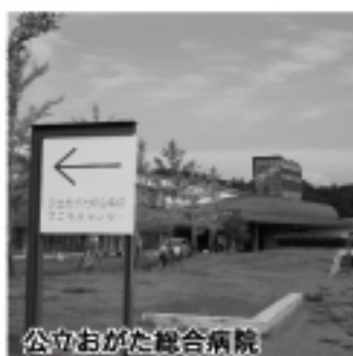
公立おがた総合病院