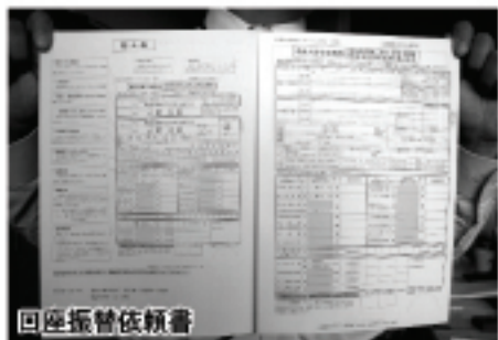
口座振替依頼書 納税は便利な口座振替で

特別徴収される給与所得者は、制度の恩恵を受けられず、不公平感がありました。公平な税徴収のため、廃止したい。