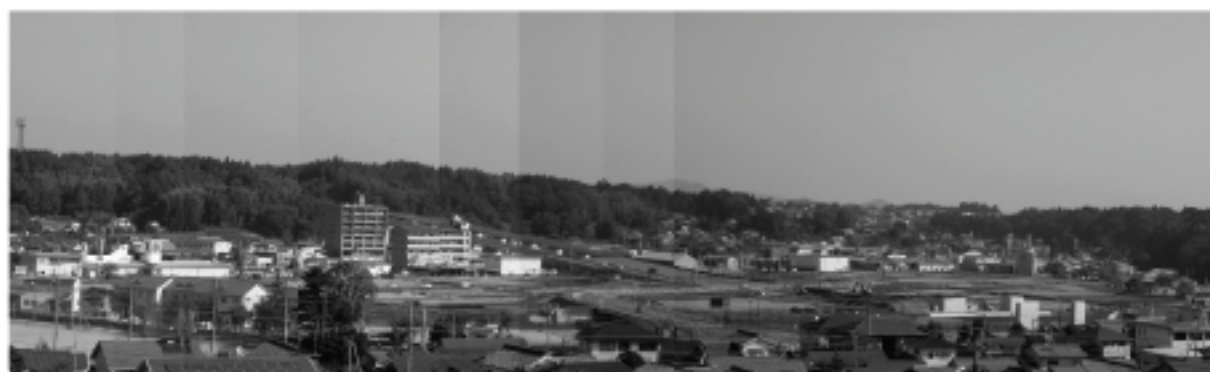
都市計画事業が実施された下赤嶺地区

平成28年度をもって終了。さらにその償還金額も平成21年度までに納税いただいた都市計画税で賄える見込みとなったことから、平成22年度以後の都市計画税の課税を当分の間、停止するものです。