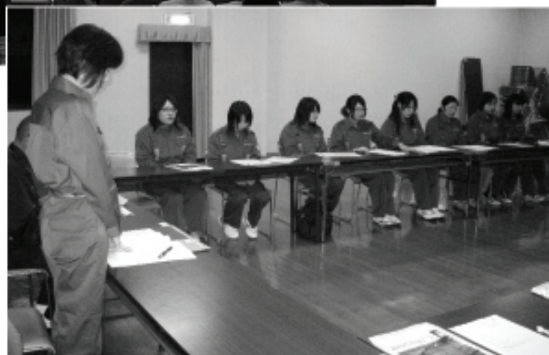
第1回女性分団会議