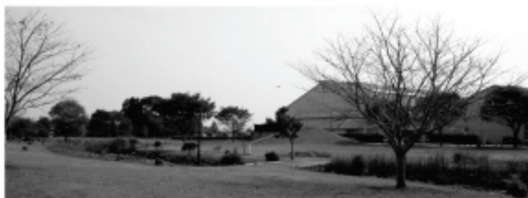
市民の憩いの場（大原総合公園）