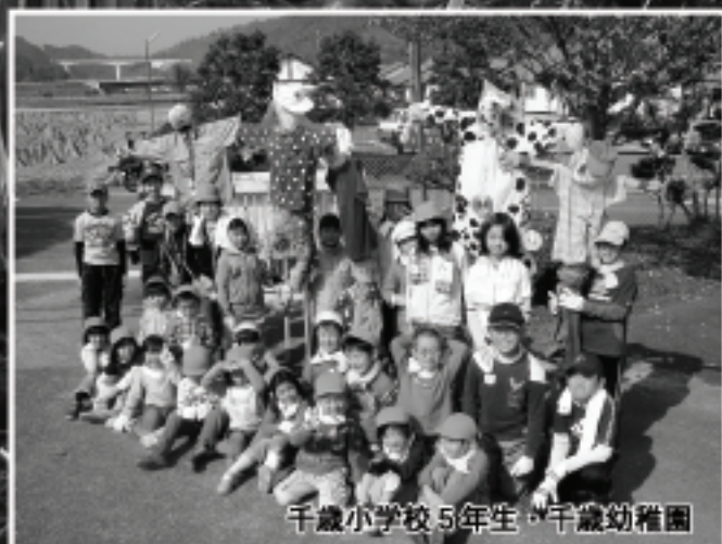
千歳小学校5年生・千歳幼稚園