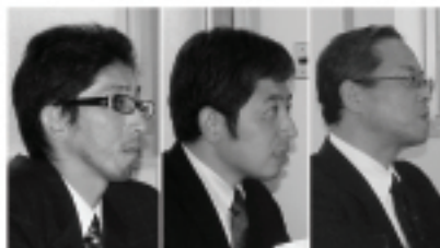
担当の企画財政課職員