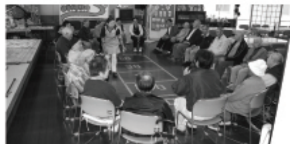
和やかなデサービス風景

また、一地方自治体が維持するのは困難との推測により、広域化されるべきと考え、国・県へお願いしてまいります。