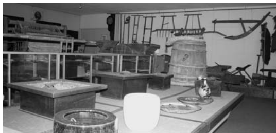
保管中の民具（大野町）