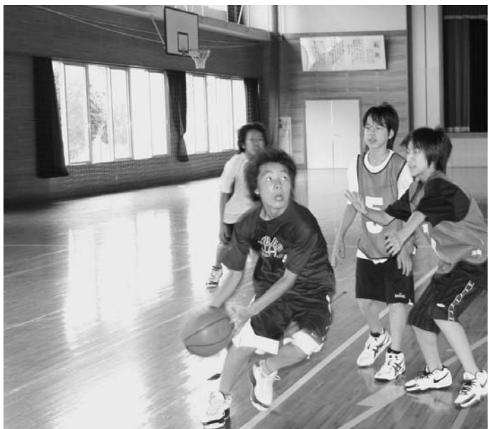
元気いっぱい、いざシュート！（三重中学校）