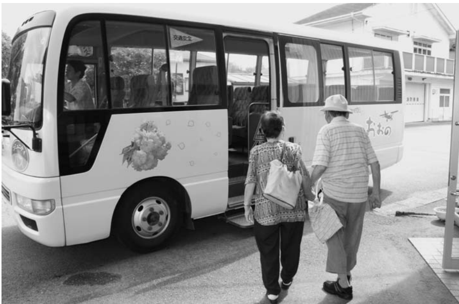
助かります。コミュニティバス（大野町）

既存路線を分析・検証し、豊後大野市ならではの地域交通の構築を図ります。その一環として、自治委員などを対象とし