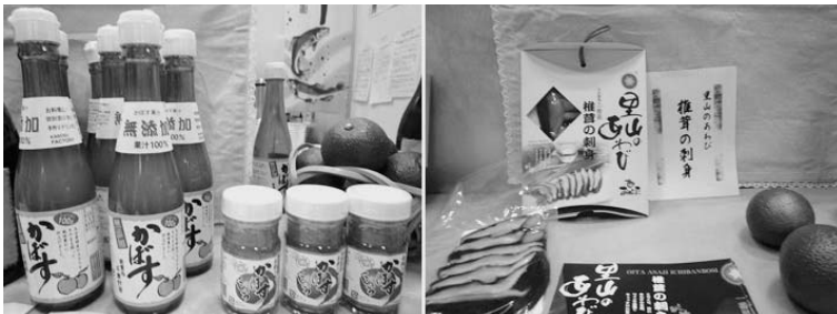
市内の農林産物加工品

会構造は残していく方策も行っていきます。平成21年度には、職員の理解と協力を得ながら、職員の地域担当制にも取り組み、市民と行政の距離をなくし、地域社会の熟成に取り組みます。