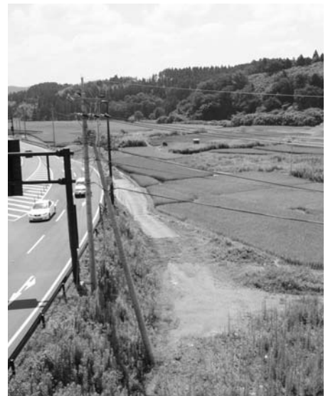
調査が行われた大野 | C付近