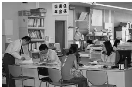
窓口での相談風景（本庁）

答 市長 本市は、中・長期的な視点での組織再編の検討時期にきています。第2期集中改革プラン策定の年であり、部長制や本庁・支所の役割分担