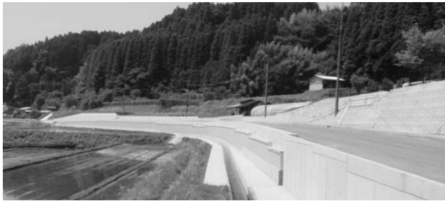
改良が進む市道宮津留線（清川町）