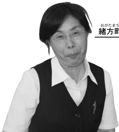
おがたまち しもじざい 緒方町下自在

先祖から引き継がれた緒方五千石の田畑を後世に残していくためにも、活力ある政策を期待しています。