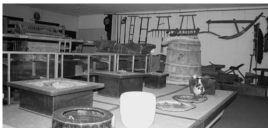
保管中の民具（大野町）