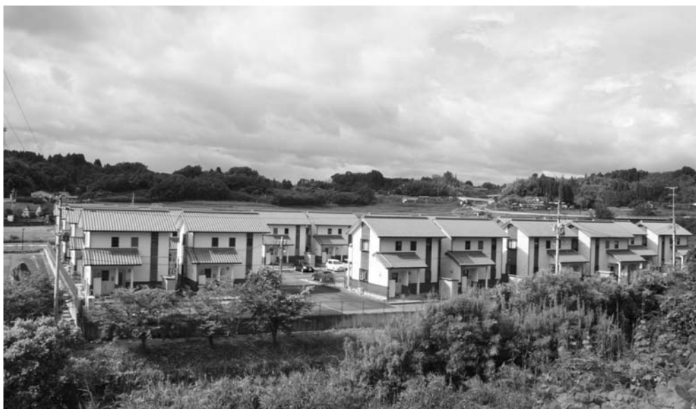
さわやか団地千歳

市の将来を考えたとき、定住化と地域活性化策は重要な課題であり、一部の担当部署に限らず、庁内組織を確立する中で連携を図りながら取り組んでまいります。