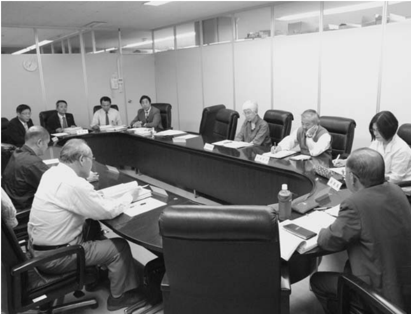
議論を交わす市民会議（本庁）