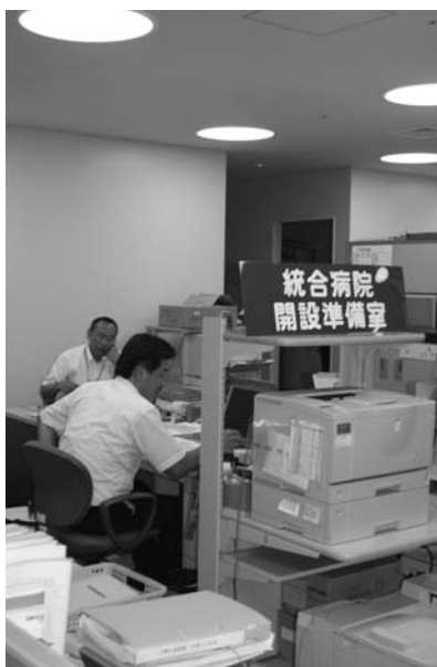
公立おがた総合病院内

また、これまでの組織を見直し、「統合病院開設準備室」、「地域医療班」の設置など体制強化を図り、県と連携し全力で取り組んでまいります。