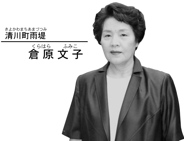
きよかわまちあまつみ 清川町雨堤