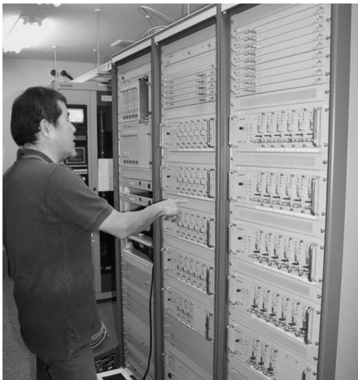
ケーブル情報センター機械室

収入見込みの試算は、加入率と使用料（自己負担額）の組み合わせにより行っています。結論としては、総合的に検討して使用料・減免制度・一般会計からの繰入額・目標加入率の設定などを行う必要があると考えています。