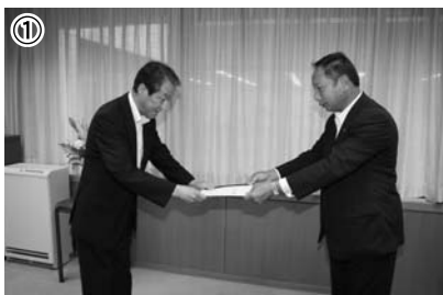
① 議長から副知事に決議文を提出

市議会は、定例会最終日に議員発議で提出された、「大分県豊肥振興局豊後大野事務所の存続を求める決議」を可決し、7月29日、大分県知事に対し、決議文を提出しました。