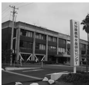
重点化が期待されるセンター