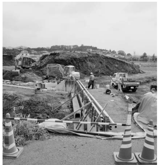
減りゆく公共事業