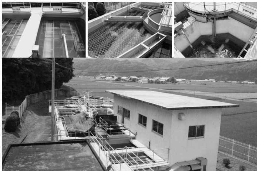
約13,000人の生活用水を供給する西原浄水場（三重町）

国は平成28年度までに、市内の公営水道の統合を図り「一市水道」を目標としています。区域拡張は、経営の採算性を見通して判断されることになり、市営水道のつなぎ込みが