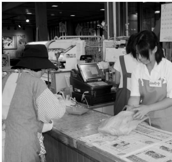
マイバッグで買い物中（道の駅きよかわ）