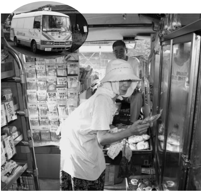
過疎地を巡る移動販売車

市としての一体感の醸成を図るため、市長として責任を持って、市民の先頭に立つ決意で取り組みたい。