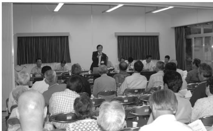
24会場で開催された市民座談会

工事請負費 42億9326万5千円 実施設計委託料 1億284万5千円 その他 9018万円