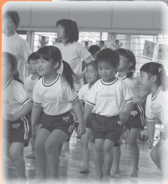
ふたばピック（双葉保育園）