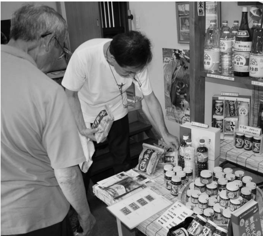
まちづくり 地域の商店も一役