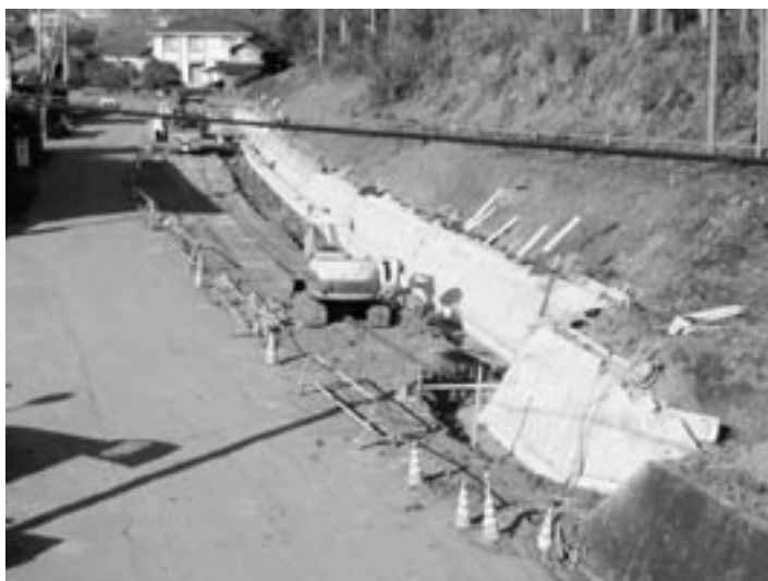
市道久知良・松谷線（三重町 内山観音入口付近）

火災により焼失した製造ラインを、新たに整備するための交付金並びに地域の林業振興に貢献してもらうための出資金