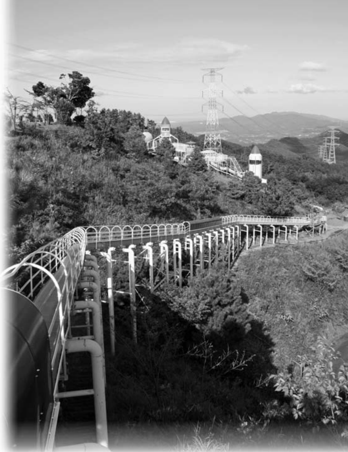
▲80メートルもあるローラーすべり台

また、ローラーすべり台、宇宙船やロケットをイメージした遊具もあり、天文台では満天の星を楽しめます。また、弘法大師伝説の「水の元」と呼ばれる湧き水があり、「縁結びの水」としても知られています。春には桜が咲き、国東半島や祖母・傾山系などを一望できる自然がいつばいの施設です。