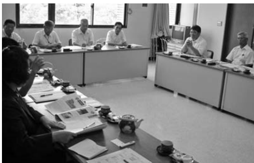
▲熱心な意見交換会を行いました

両市議会の熱意と親 切さで時の経つのを忘 れるほど熱心な意見交 換ができました。 優れている点、反省 する点もあり実り多い 視察となりました。