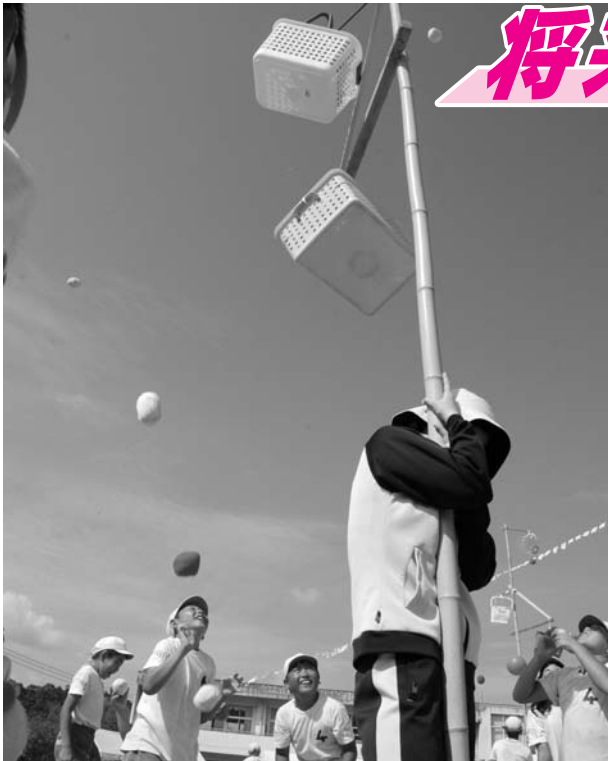
▶どれに入れようかな (千歳小学校)