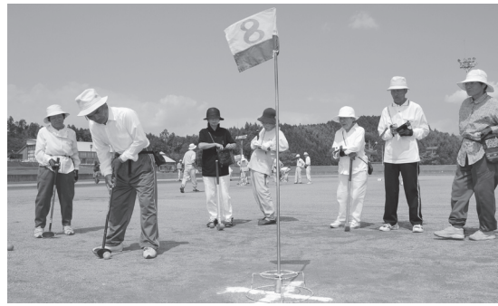
よーく、狙ってね!(緒方町)

小学校入学前までの医療費無料化、第2子3歳未満児の保育料半額減免を検討しています。 放課後児童クラブは、現在9箇所を1箇所増やし、市内全域の子育て支援ネットワークづくりに努めます。