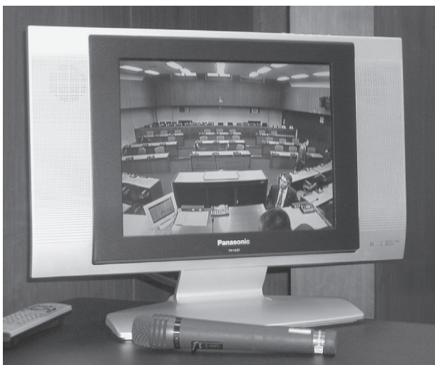
議会中継を庁舎内へ流している岐阜県下呂市議会(広報委員会研修より)

放課後児童クラブの運営は、直営・委託を問わず市内9箇所の情報交換など、横のつながりが必要であると考えています。 今後そのような機会の開催を検討してネットワークの形成に努めていきます。