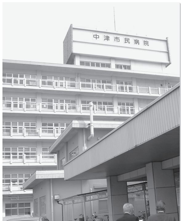
地域の安心のよりどころ…市民病院

小児科医療の充実を図り、安心して子供を育てられるよう周辺町村と連携をし、24時間体制となっています。二次医療の充実と医療連