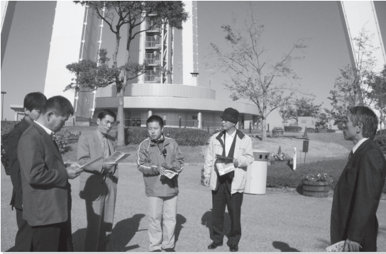
広大な三川公園の維持管理は？

環境共生型テーマパーク河川環境楽園は、岐阜県各務原市にあり、ここは、国営公園、県立公園、自然共生センターなどで構成された複合型の公園です。