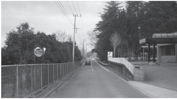
ここは、狭いなあー。

国道502号の清川地区が19年度に完了予定です。質問の区間については、期成会として、国、県に強く要望していきます。