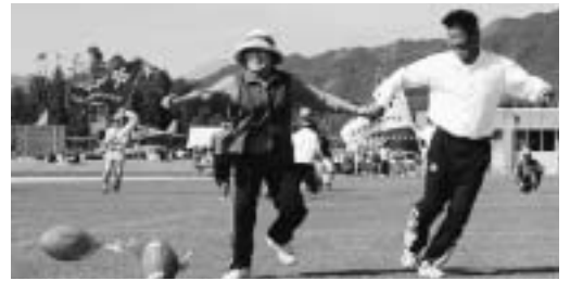
▲「ありゃ、どこに飛んで行きよの〜」

第50回豊後大野市大野町体育祭が10月23日、大野総合運動公園グラウンドで開催され、参加者は秋空の下さわやかな汗を流しました。 競技は町内6チームに分かれて開始。真剣に取り組む中にも笑顔あふれる選手たちに応援席から大きな声援が送られていました。 優勝は南部チーム、準優勝は中部西チーム、3位は中部東チーム。応援優勝は中部西チーム、準優勝は南部チーム。みなさん大変お疲れさまでした。