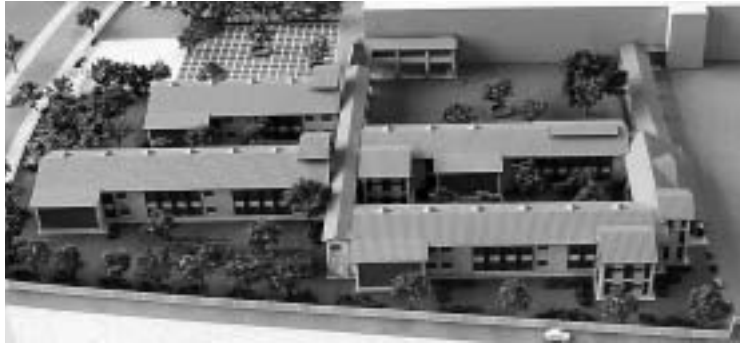
▲新校舎完成模型図 県立高校では初の木造二階建校舎

同校の基幹目的には、豊後大野市や竹田市など地域の発展を担う人づくりということが挙げられています。