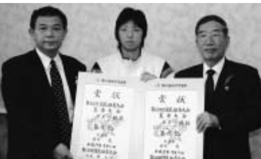
▲大分国体出場をめざしてがんばってください