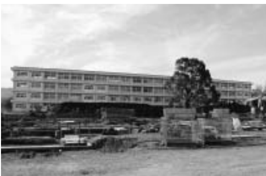
▲着々と工事が進んでいます(現三重農業高等学校前)

ます。また「自分から進んで学ぶ心と態度」「規律を守り、礼節を重んじる心と態度」「助け合い競い合い、互いを高め合う心と態度」「郷土を誇りに思い郷土を大切にすると心と態度」「スポーツ・文化活動に励み、心身の健康増進に努める心と態度」の育成を5本柱として、「鍛える」「伸ばす」「満足する」の指導方針のもと、進学や就職、高度な資格の取得など、生徒の将来を確実なものにするための教育活動を展開します。 全3期で建設されている新教室棟のうち、第1期工事(普通教室棟)は来年3月中に完成予定。新しい生徒の受け入れ準備が、着々と進んでいます。