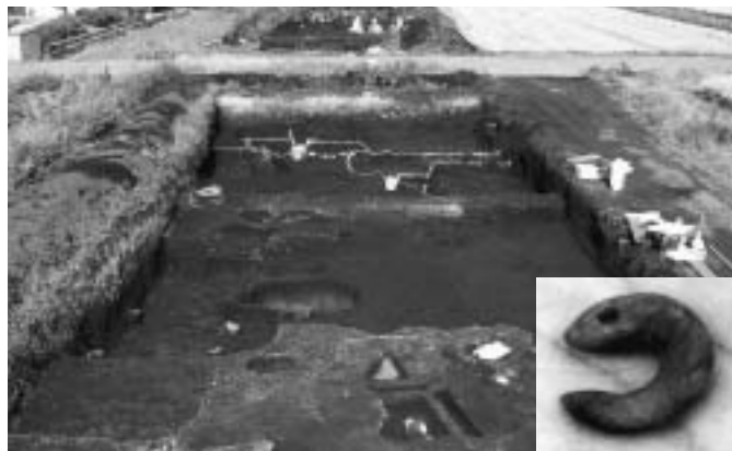
▲遺跡全景（西方向から）

この百枝折立遺跡の周辺は、古来より生活に適した自然環境に恵まれ、これまで行われた発掘調査でも大規模な集落遺跡が確認されています。今後のさらなる調査研究が期待されるところです。