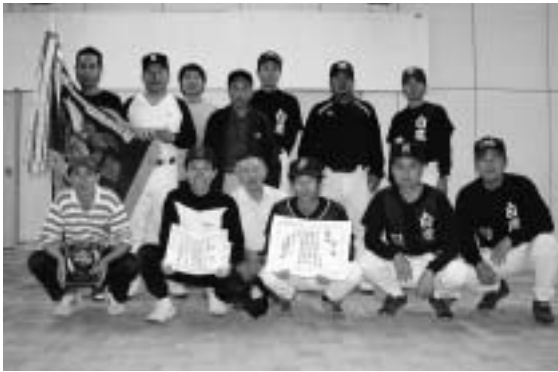
▲A部優勝の柴山地区のみなさん