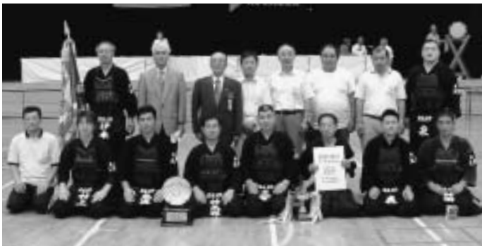
▲初優勝おめでとうございます