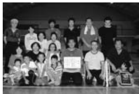
▲優勝した下町チームのみなさん

優勝 下町チーム（町） 準優勝 北泉チーム（坪泉） 第3位 中熊チーム（中熊） 第3位 石ヶ原チーム（池在）