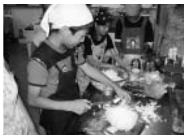
▲スタッフの指導で夕食作りをする子どもたち

合宿を通じて時間厳守や言葉遣い、挨拶の仕方、掃除の仕方、はしの持ち方、スリッパの整頓等基本的な生活習慣を反復して学んだようです。