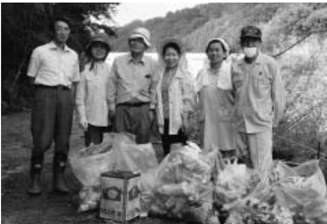
▲こんなにもたくさんのごみがありました

清掃活動後は、周辺の地形や植生を学んだ皆さん。きれいになった滝を眺めながら、充実した学習になったようです。