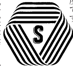
厚生労働大臣認可

厚生労働大臣認可の約款に従って営業することを登録した「理容店」「美容店」「クリーニング店」「一般飲食店」「めん類飲食店」では、店頭にSマークを掲げています。登録店は、安心・安全・衛生を約束する信頼できるお店です。