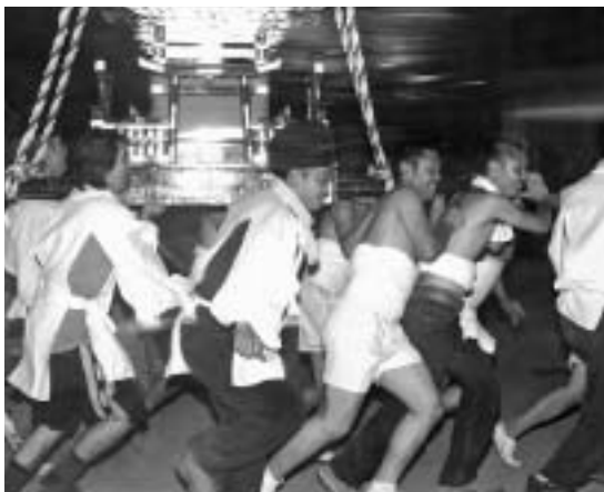
▲祭り終盤、神輿が本部へ突進!

黄金色の稲穂が緒方平野を埋め尽くす秋。緒方町ではこの時期に、五穀豊穡を祝う祭り、「緒方五千石祭」が行われます。昨年は雨天のため中止となったこともあり、この日は祭りを待ちわびた来場者が多数訪れました。 9月23日午前9時30分、会場の緒方小学校グラウンドには町内各社から15基の神輿が担ぎ込まれ、獅子舞や神楽、小富士太鼓、そして緒方井路修復作業の模様を踊りとした「緒方千本づき」などの郷土芸能が繰り広げられ、夜には花火大会。神輿が引き上げる午後9時ごろまで緒方町は祭り一色となりました。