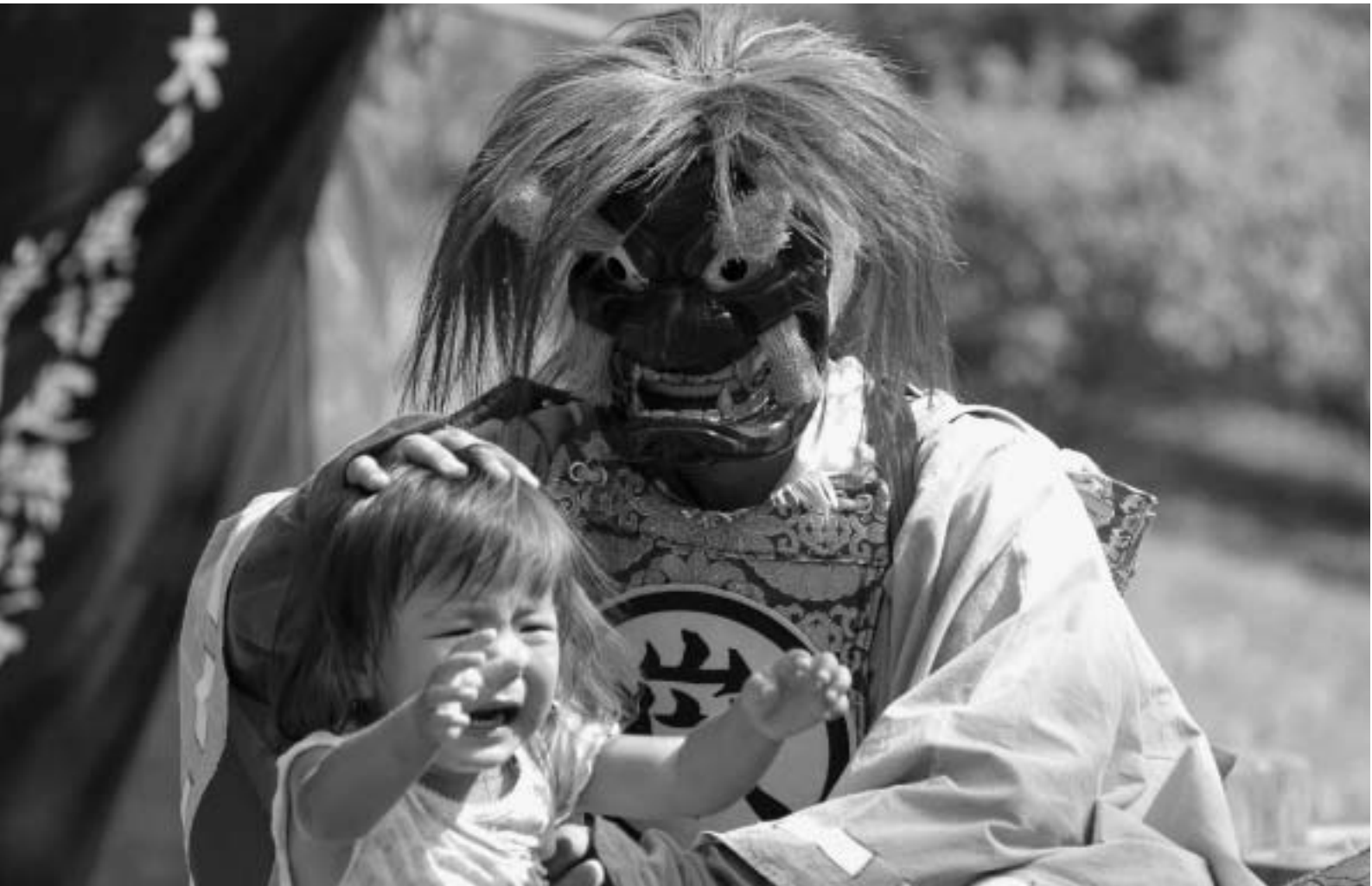
▲御嶽山秋季大祭にて（清川町）