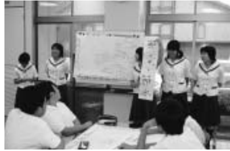
▲環境学習発表会の様子

1年生は、総合学習で外部講師を招き、尾平鉾山を中心に現地学習を実施しました。また、班毎に「税を通して生き方を考える」目的で調べ学習を行い、期末PTAの折に発表会を開きました。