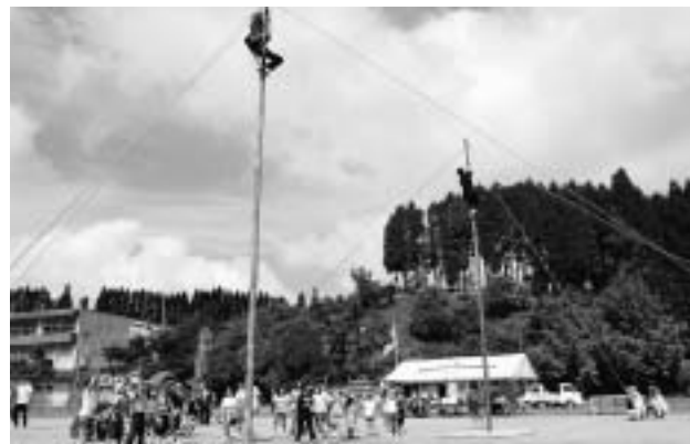
▲青年団による竹登り