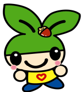
森林づくりマスコット キャラクター もりりん

森林の種類によって手続きが違います。 伐採する前にまず県振興局・市町村ま たは森林組合で確認してください。