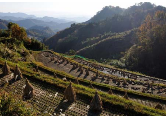
四辻峠からしだはらダムの風景