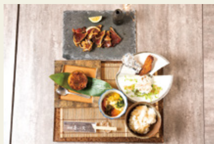
■ 創作鮓 喜久