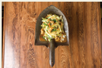
■ 本格炭火焼 小吾郎