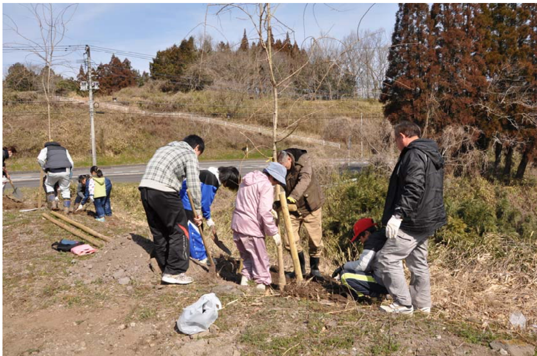
昨年の植樹のようす

平成30年3月11日(日)に、山頂から中腹までの桜ロード沿線に、「ジンダイアケボノ」というソメイヨシノに似た桜を100本植樹します。今年も「瀬戸内オリーブ基金」から助成を受けることになりました。子どもから高齢者まで、幅広い世代の町民皆さんにご参加いただき「思い出づくり」「人づくり」「故郷づくり」をしたいと思います。参加にはボランティア部の登録が必要になります。全戸に登録同意書を配布しますので、是非登録をお願いします。