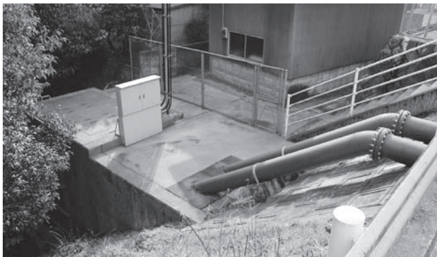
河島住宅排水ポンプ

この時点で河島住宅近辺に消防団員の配置も依頼しました。職員は11名いますが、避難所開設に伴い、小学校体育館、公民館、集会所に待機させました。また、県道や市道の冠水箇所、崩壊危険箇所の現地確認、対応を行いました。