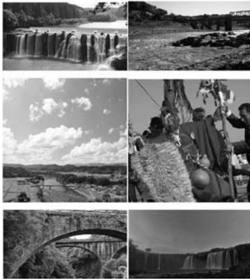
豊 後 大 野 市

見ますと平成22年には3万9452人となつています。平成26年には、民間の有識者から人口減少に警鐘を鳴らすレポートが発表され、また、政府の諮問機関からも日本全体の人口減少と、それによる国力の衰退が指摘されました。これを受け、政府において地方創生の取り組みが始まり、本市でも平成27年10月に豊後大野市総合戦略を策定しました。